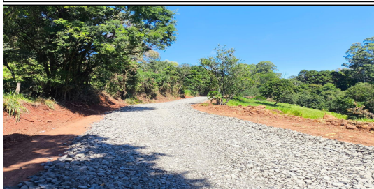
8 | SERVIÇO EXECUTADO DE BASE / SUB-BASE - ESTRADA RURAL LINHA BOM JESUS