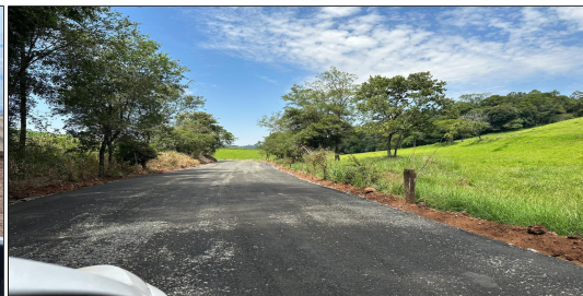
15 | SERVIÇO EXECUTADO DE REVESTIMENTO- ESTRADA RURAL LINHA BOM JESUS