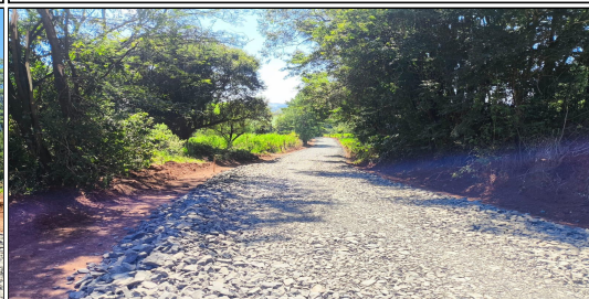
9 | SERVIÇO EXECUTADO DE BASE / SUB-BASE - ESTRADA RURAL LINHA BOM JESUS