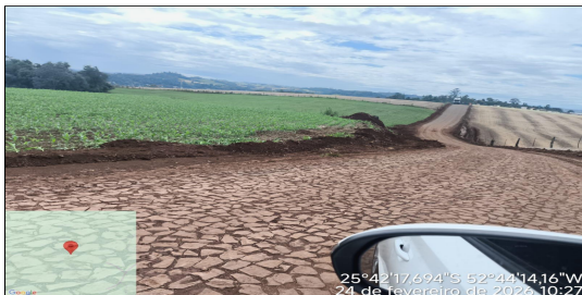
16 | SERVIÇO EXECUTADO DE TERRAPLENAGEM - ESTRADA RURAL LINHA BOM JESUS