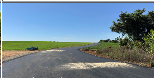
11 | SERVIÇO EXECUTADO DE REVESTIMENTO - ESTRADA RURAL LINHA BOM JESUS