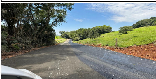
14 | SERVIÇO EXECUTADO DE REVESTIMENTO - ESTRADA RURAL LINHA BOM JESUS