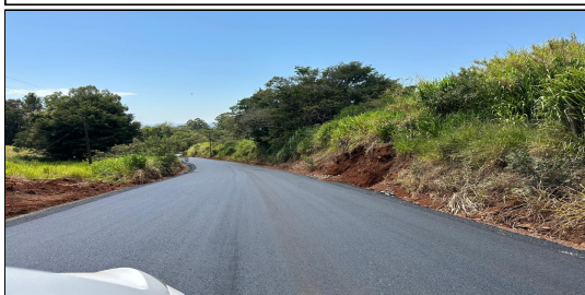
12 | SERVIÇO EXECUTADO DE REVESTIMENTO- ESTRADA RURAL LINHA BOM JESUS