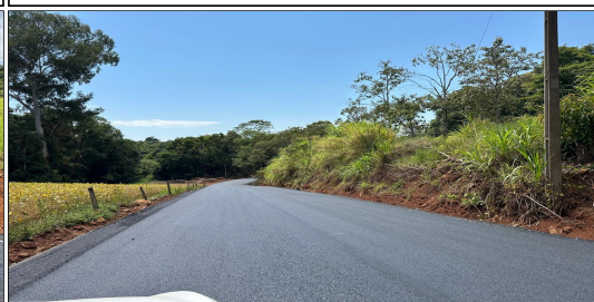
13 | SERVIÇO EXECUTADO DE REVESTIMENTO - ESTRADA RURAL LINHA BOM JESUS