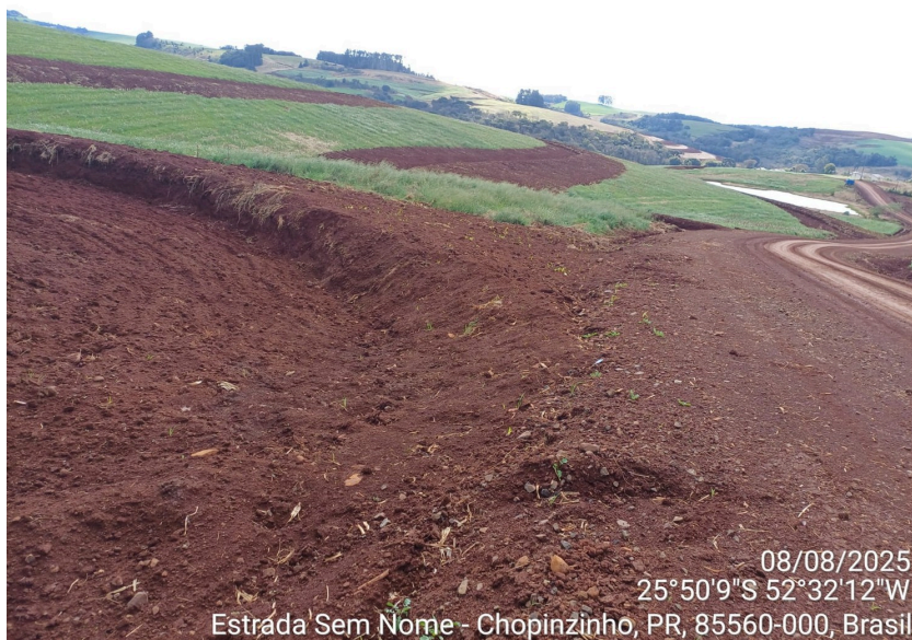
(Imagens da ÁREA V. Detalhe da presença dos terraços na ÁREA V.)