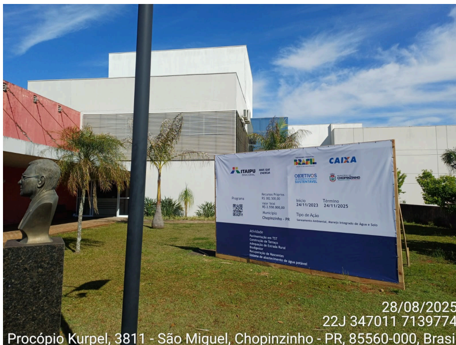
Procópio Kurpel, 3811 - São Miguel, Chopinzinho - PR, 85560-000, Brasil (Imagem da placa do convênio instalada no Paço Municipal)