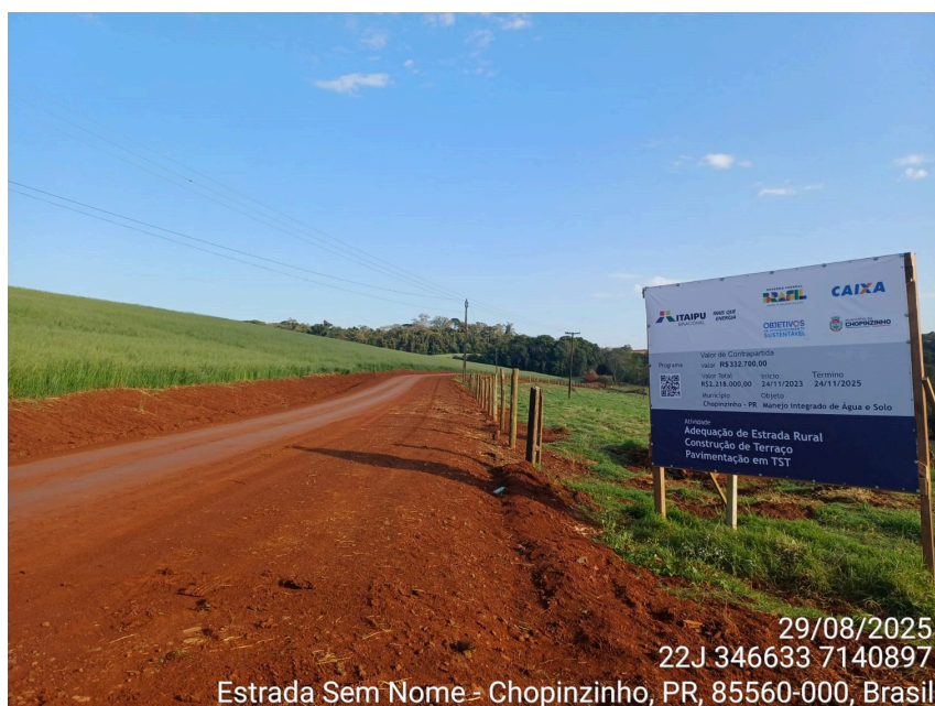
(Imagem da placa da obra à margem da estrada readequada)