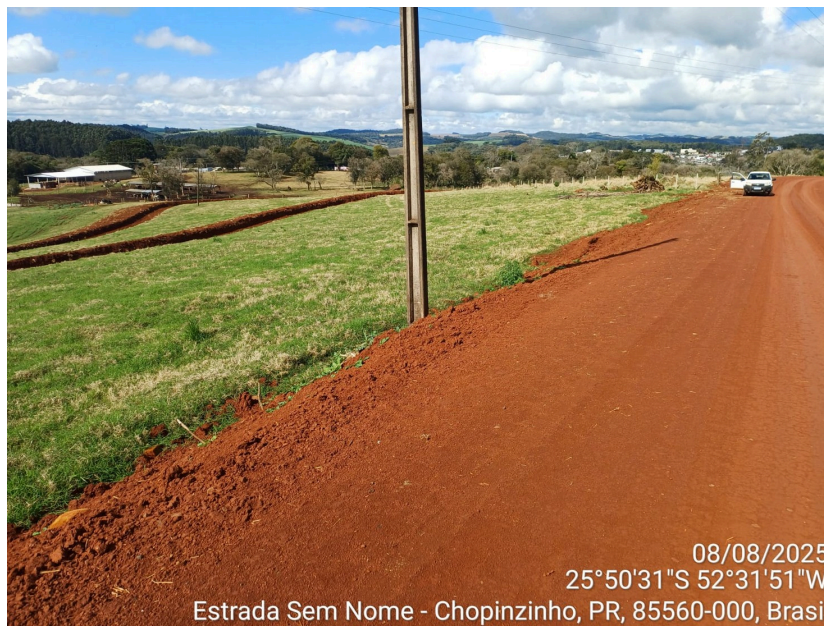
(Imagens da ÁREA I . Terraços construídos em área de pastagem)