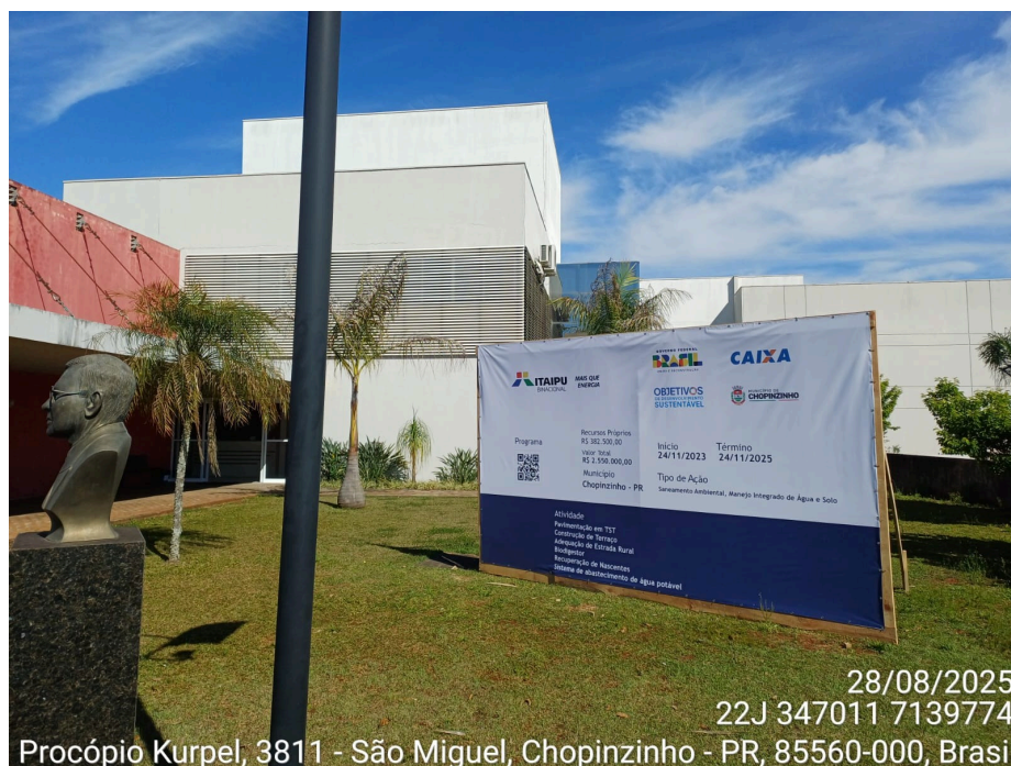
Procópio Kurpel, 3811 - São Miguel, Chopinzinho - PR, 85560-000, Brasil (Imagem da placa do convênio instalada no Paço Municipal)