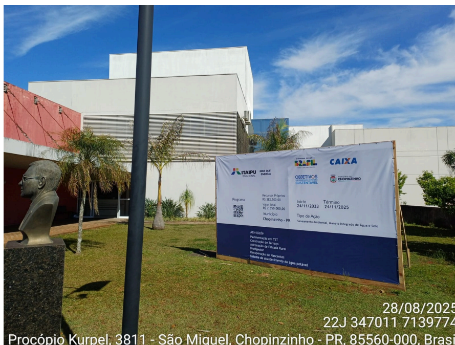
(Imagem da placa do convênio instalada no Paço Municipal)

- Seguem fotos da construção dos terraços.