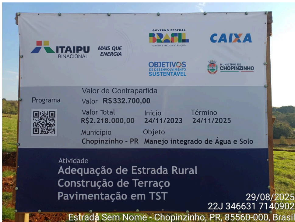
(Imagem da placa da obra)