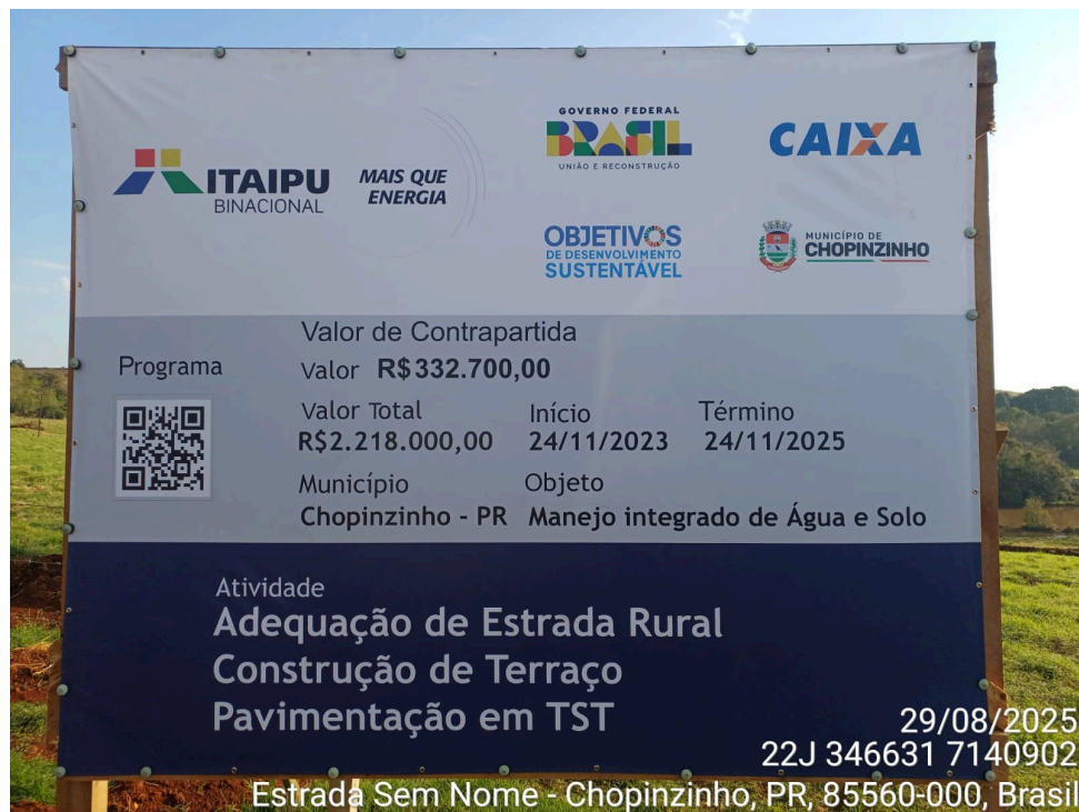
(Imagem da placa da obra)