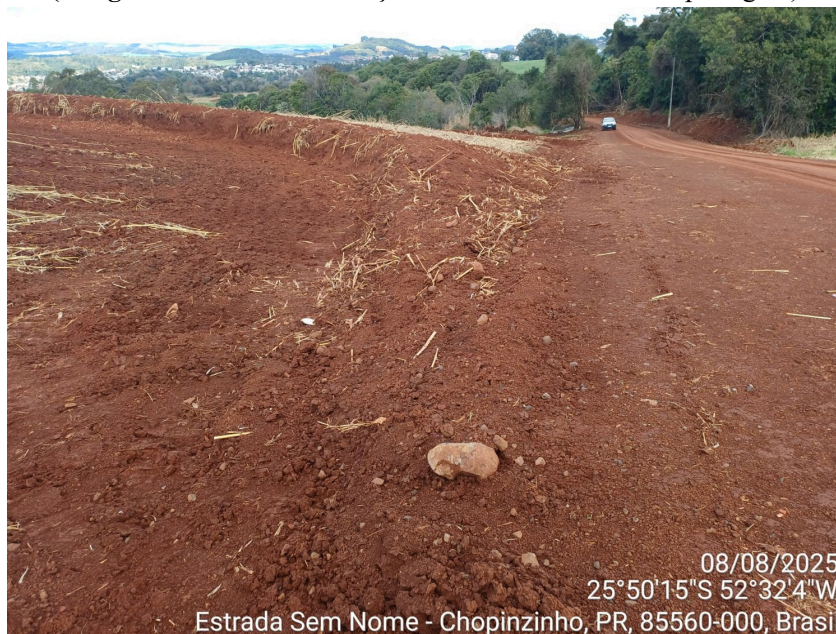
(Imagens da ÁREA I . Detalhe para o encaixe do terraço em área de lavoura, com a estrada readequada.)