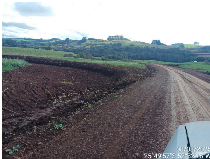
(Imagens da ÁREA V. Detalhe do encaixe do terraço com a estrada. Ao fundo da imagem terraço na ÁREA IV.)