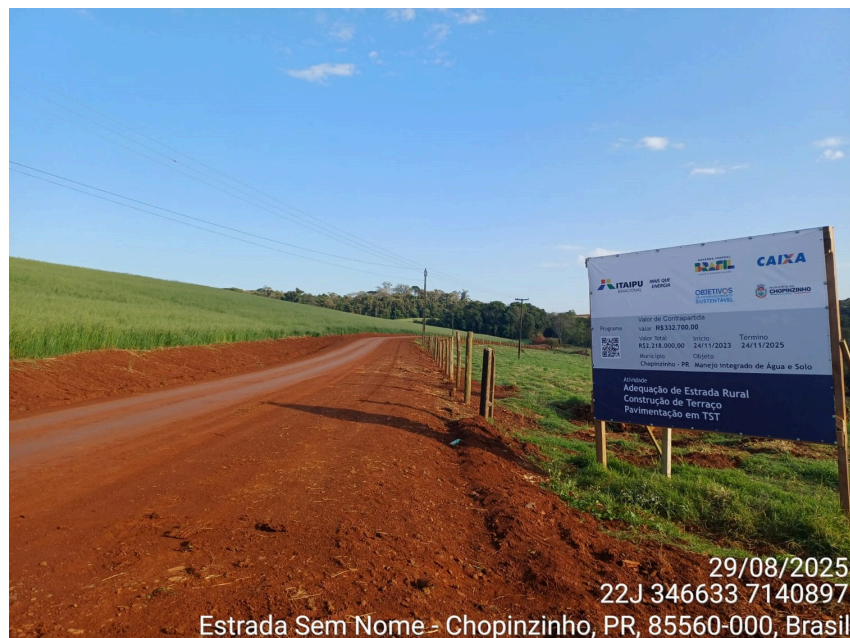
(Imagem da placa da obra à margem da estrada readequada)