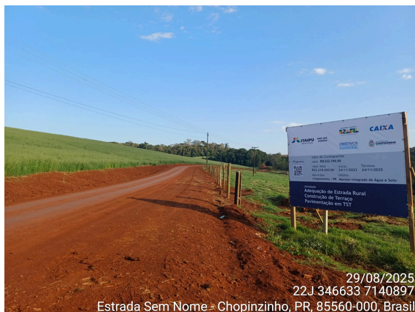
(Imagem da placa da obra à margem da estrada readequada)