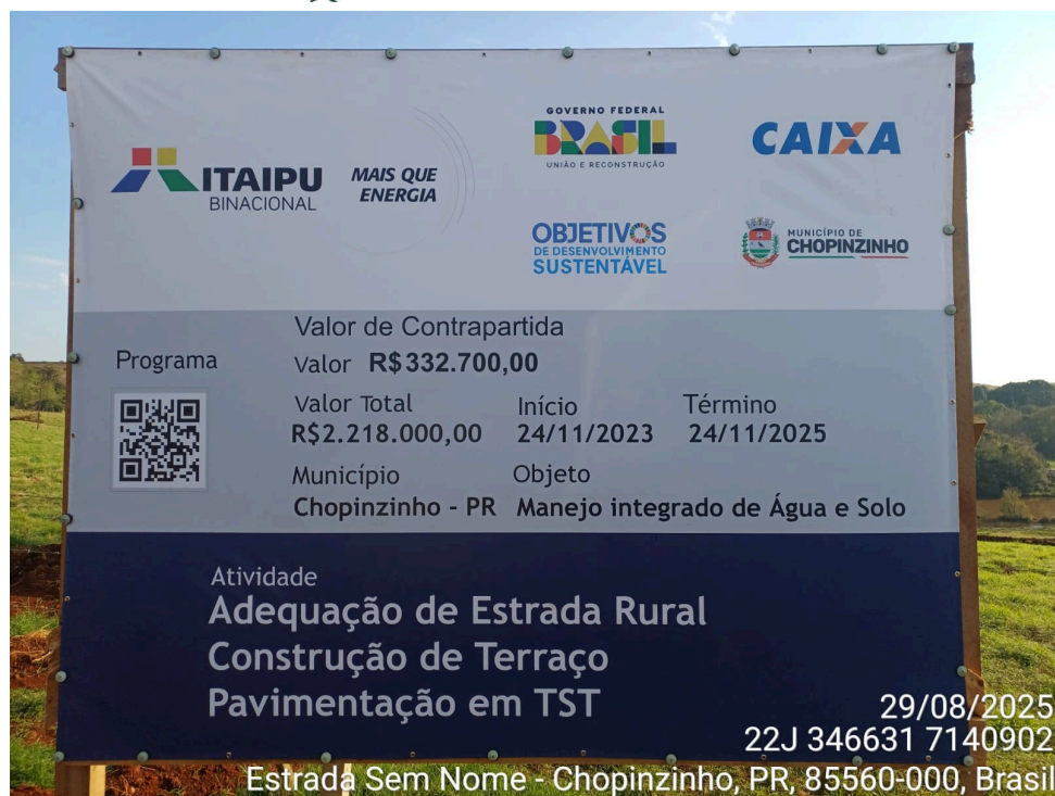
(Imagem da placa da obra)