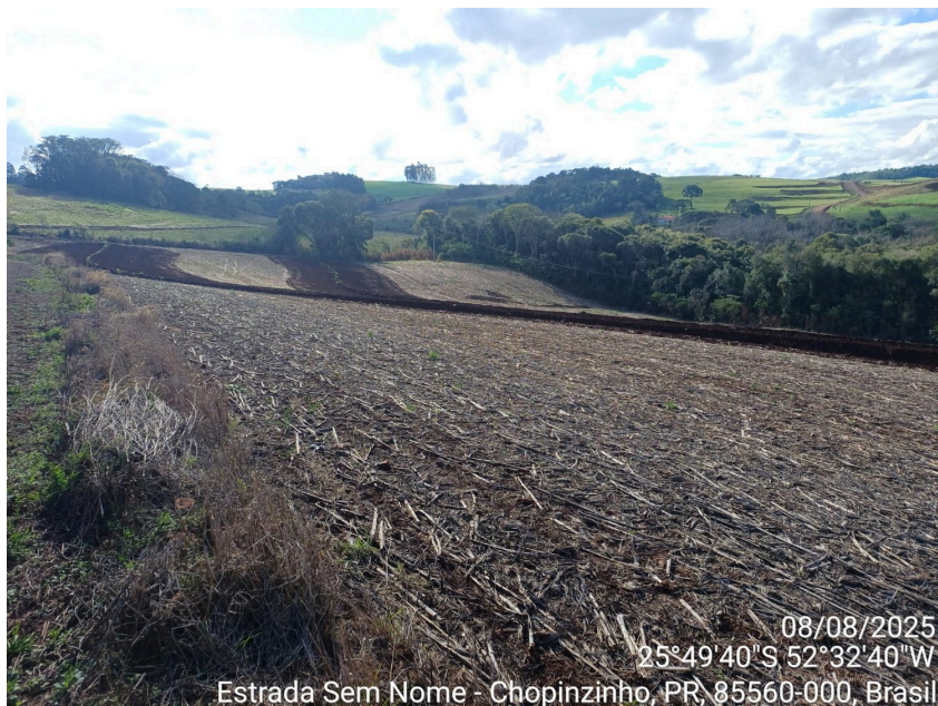
(Imagens da ÁREA III. Sequência dos terraços da imagem anterior)