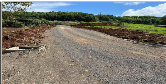
13 | RUA 03 – SERVIÇO EXECUTADO DE TERRAPLENAGEM, DRENAGEM