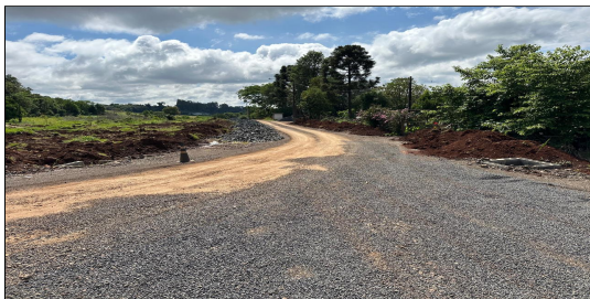
12 | RUA 03 – SERVIÇO EXECUTADO DE TERRAPLENAGEM, DRENAGEM