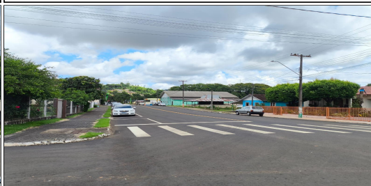
15 | RUA ANTÔNIO DIONÍSIO REICHART, SERVIÇO DE SINALIZAÇÃO DE TRÂNSITO EXECUTADO