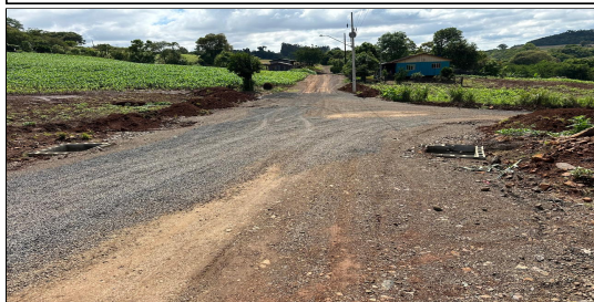
6 | RUA 02 – SERVIÇO EXECUTADO DE TERRAPLENAGEM, DRENAGEM