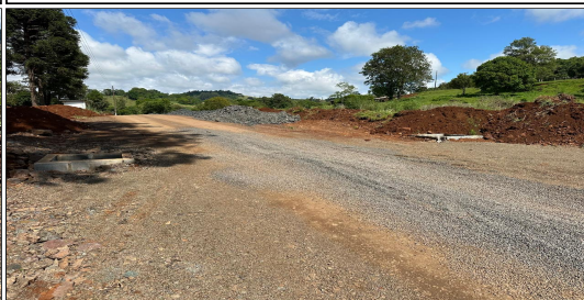
7 | RUA 02 – SERVIÇO EXECUTADO DE TERRAPLENAGEM, DRENAGEM