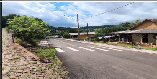
19 | RUA SANTOS DUMONT, SERVIÇO DE SINALIZAÇÃO DE TRÂNSITO EXECUTADO