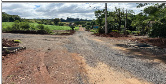
8 | RUA 02 – SERVIÇO EXECUTADO DE TERRAPLENAGEM, DRENAGEM