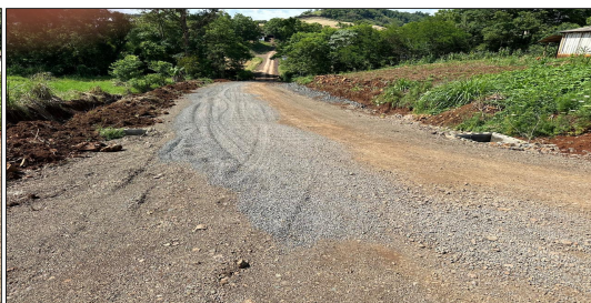
5 | RUA 01 – SERVIÇO EXECUTADO DE TERRAPLENAGEM, DRENAGEM