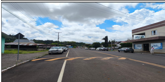
16 | RUA ANTÔNIO DIONÍSIO REICHART, SERVIÇO DE SINALIZAÇÃO DE TRÂNSITO EXECUTADO