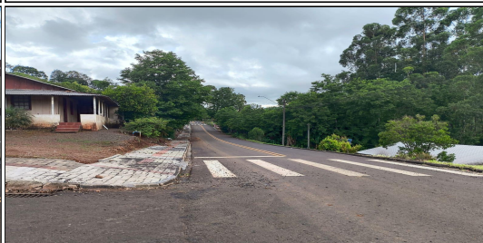
17 | RUA BARRÃO DO RIO BRANCO, SERVIÇO DE SINALIZAÇÃO DE TRÂNSITO EXECUTADO