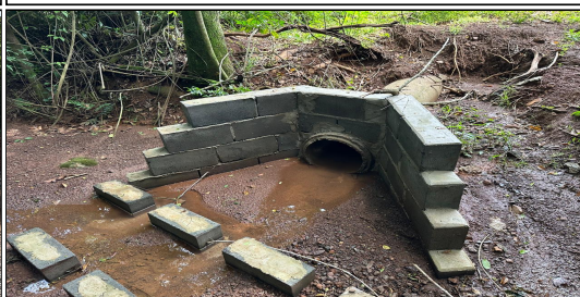
9 | RUA 02 – SERVIÇO EXECUTADO DE TERRAPLENAGEM, DRENAGEM