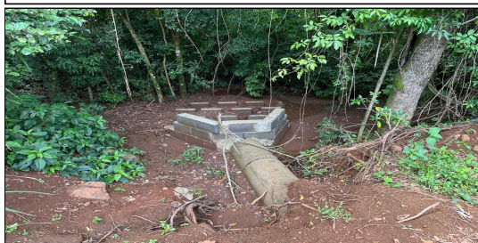
10 | RUA 02 – SERVIÇO EXECUTADO DE TERRAPLENAGEM, DRENAGEM