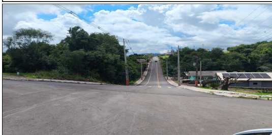
14 | RUA COMENDADOR ARAÚJO, SERVIÇO DE SINALIZAÇÃO DE TRÂNSITO EXECUTADO