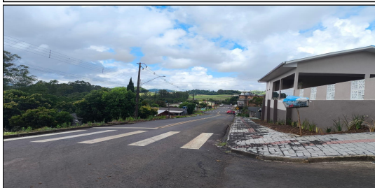
18 | RUA BARRÃO DO RIO BRANCO, SERVIÇO DE SINALIZAÇÃO DE TRÂNSITO EXECUTADO