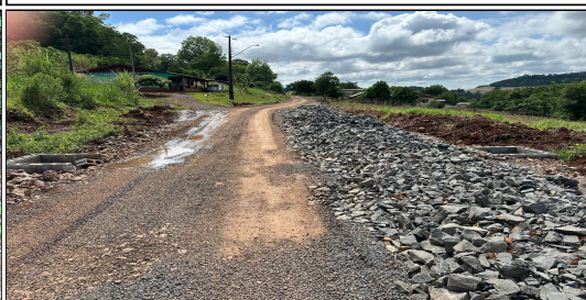
11 | RUA 04 – SERVIÇO EXECUTADO DE TERRAPLENAGEM, DRENAGEM