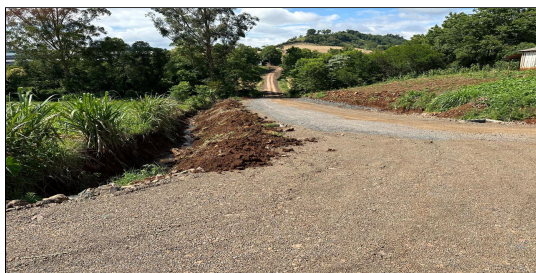
4 | RUA 01 – SERVIÇO EXECUTADO DE TERRAPLENAGEM, DRENAGEM