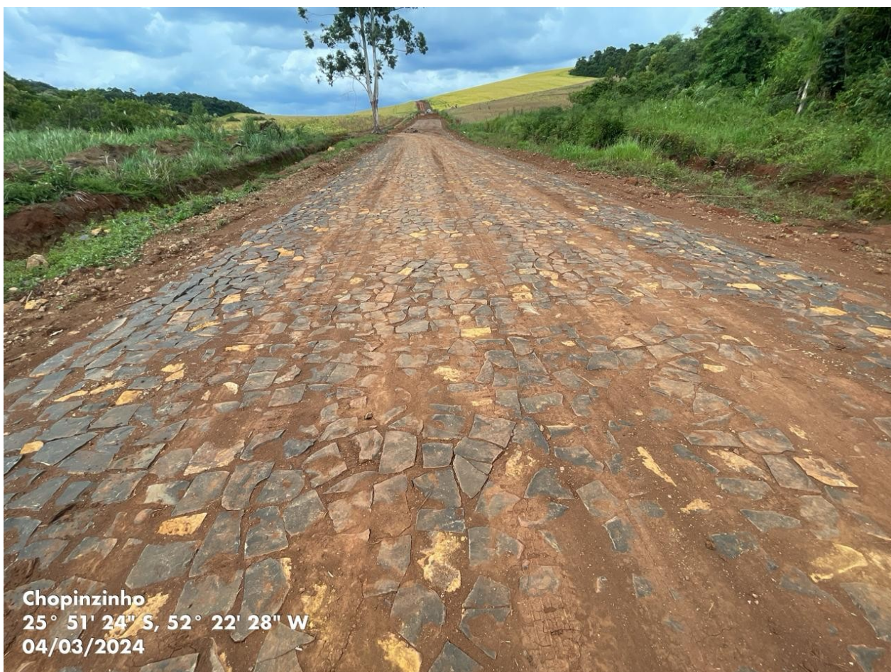
Chopinzinho 25° 51' 24" S, 52° 22' 28" W 04/03/2024