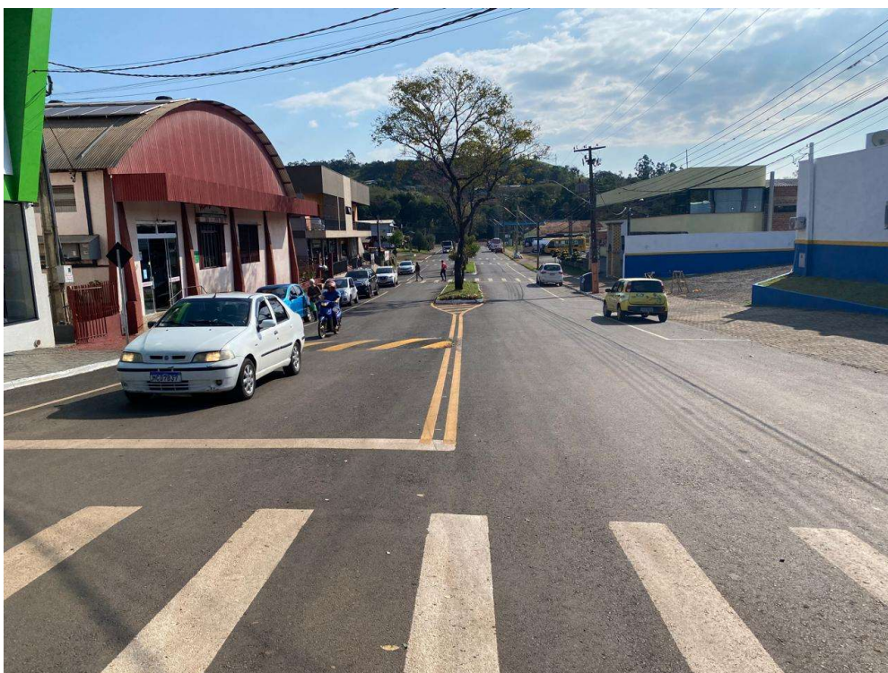
Rua Antônio Dionizio Reichart