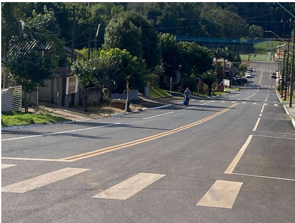
Rua Dom Pedro II