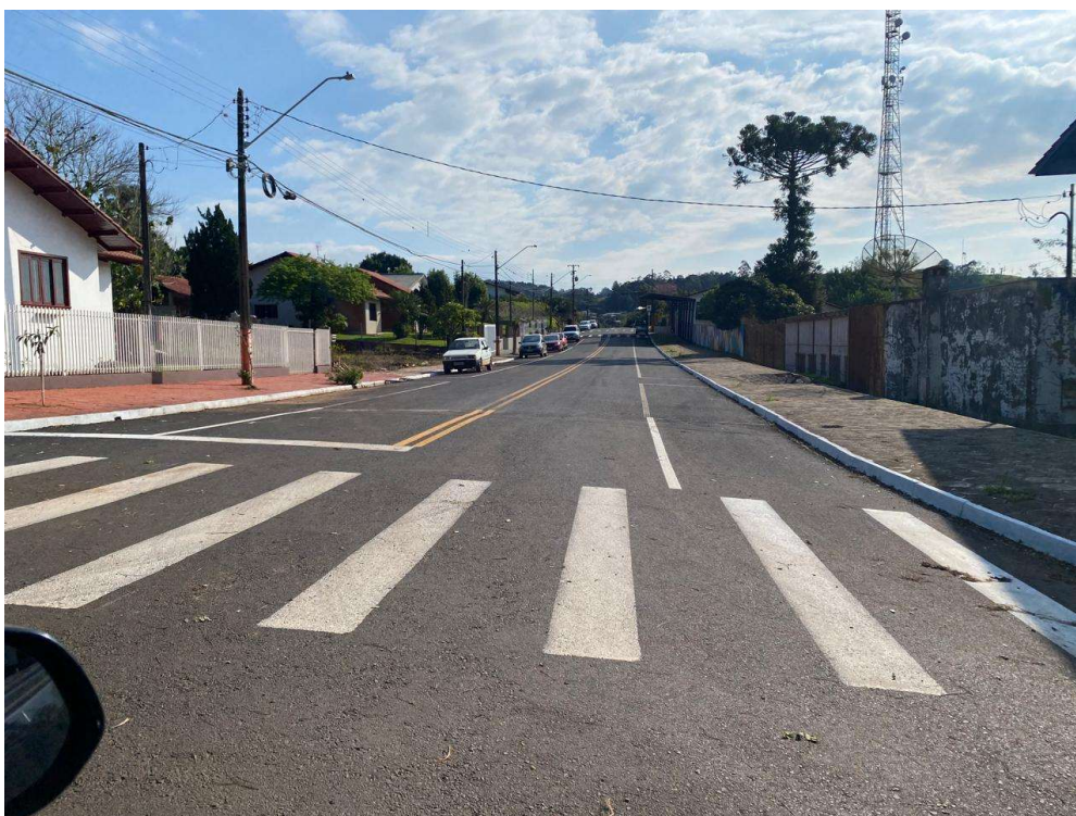
Rua João Inácio Tomas