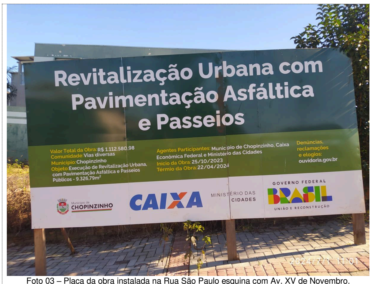
Foto 03 – Placa da obra instalada na Rua São Paulo esquina com Av. XV de Novembro.