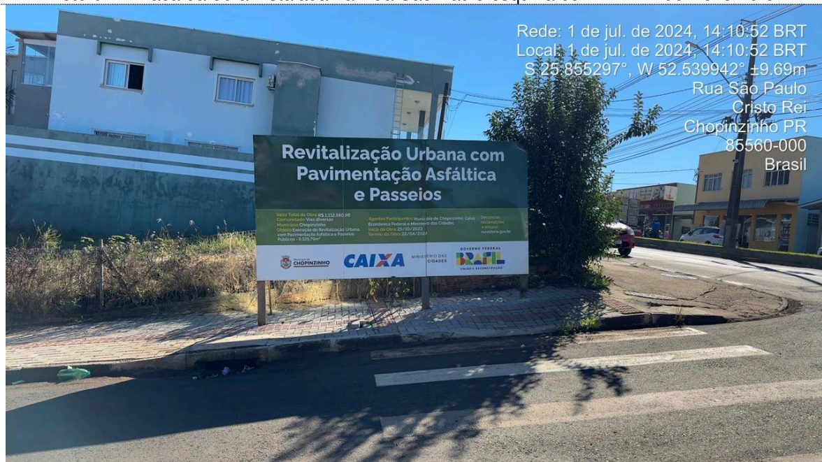
Foto 02 – Placa da obra instalada na Rua São Paulo esquina com Av. XV de Novembro.