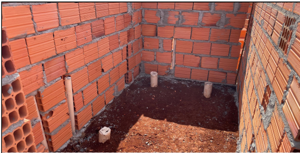
4 | ALVENARIA