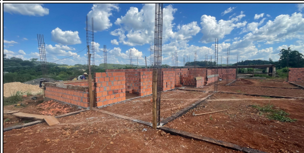
9 | ALVENARIA, ARMADURAS PILARES CONTRAVERGAS