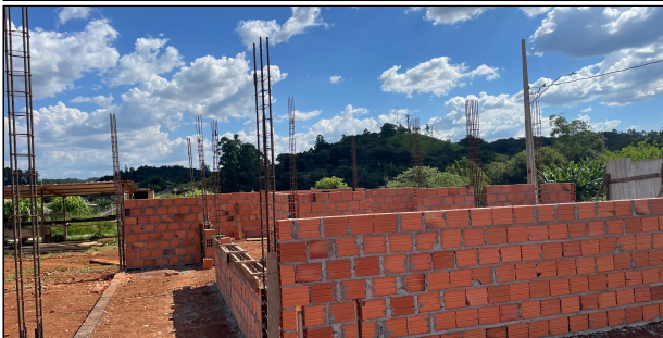
6 | ALVENARIA, ARMADURAS PILARES CONTRAVERGAS