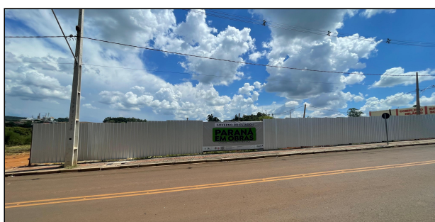
9 | PLACA DE OBRA