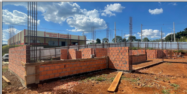
7 | ALVENARIA, ARMADURAS PILARES CONTRAVERGAS