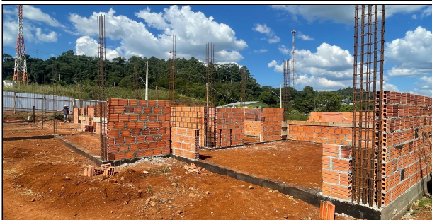
8 | ALVENARIA, ARMADURAS PILARES CONTRAVERGAS