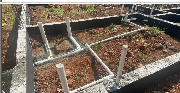
1 | TUBULAÇÃO ESGOTO E IMPERMEABILIZAÇÃO