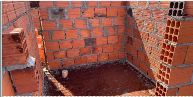
3 | ALVENARIA