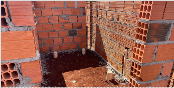
2 | ALVENARIA