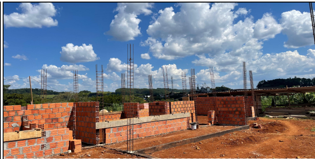
5 | ALVENARIA, ARMADURAS PILARES CONTRAVERGAS