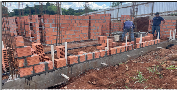
11 | ALVENARIA, ARMADURAS PILARES CONTRAVERGAS

Versão digital: https://portaldosmunicipios.pr.gov.br/projeto-medicao/17954/lote/22180/medicao/18038/relatorio-fotografico/7331