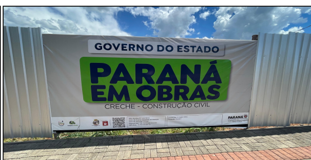
11 | PLACA DE OBRA