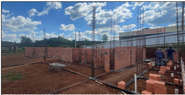
10 | ALVENARIA, ARMADURAS PILARES CONTRAVERGAS