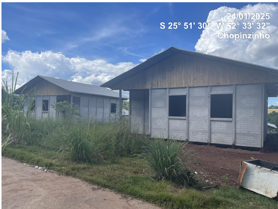
Foto 02 - Casas tipo Acessível de frente para a Rua Joaquim Fávero (Local 06)