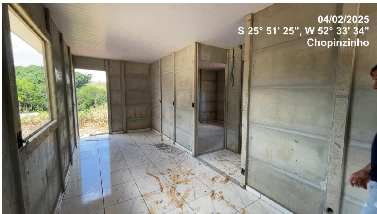
Foto 09 – Habitação com serviço de revestimento cerâmico, azulejos, elétrica, forro e esgoto interno concluídos (Local 02-07)