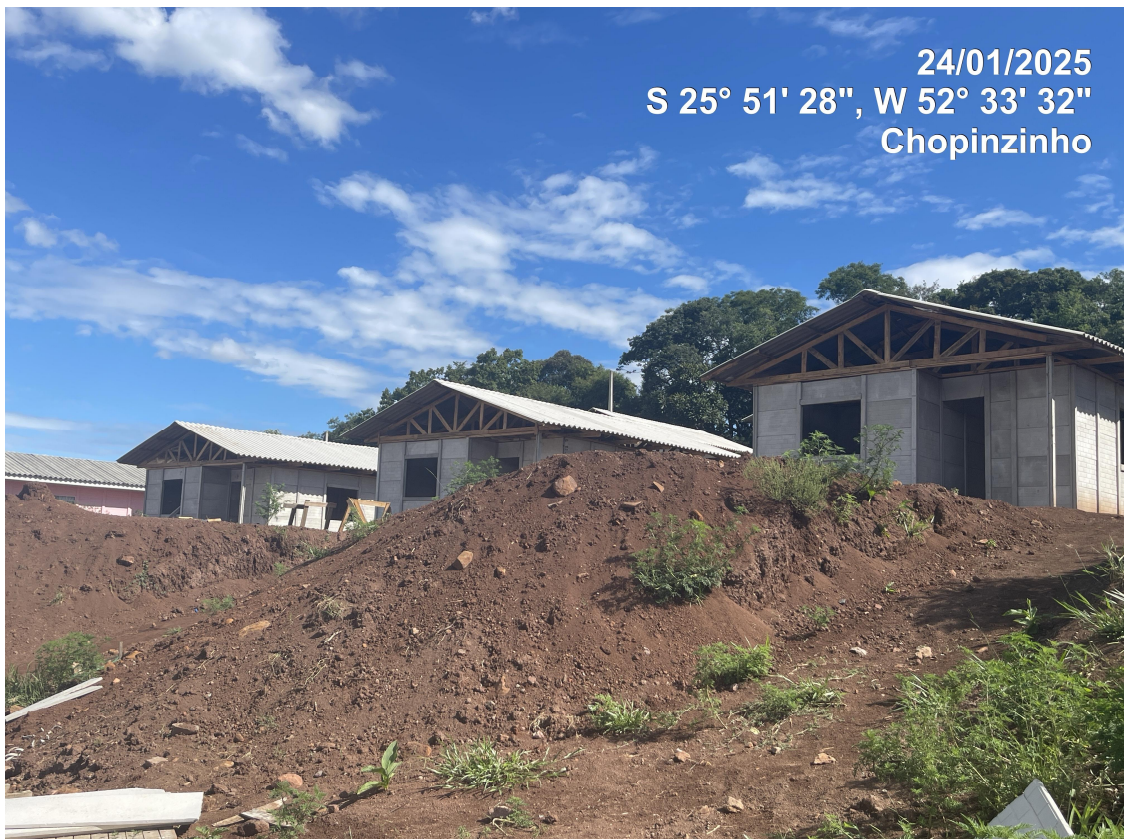
Foto 05 - Casas Padrão de frente p/ R. Nébito Simões de Oliveira (Local 05) – Vista 02