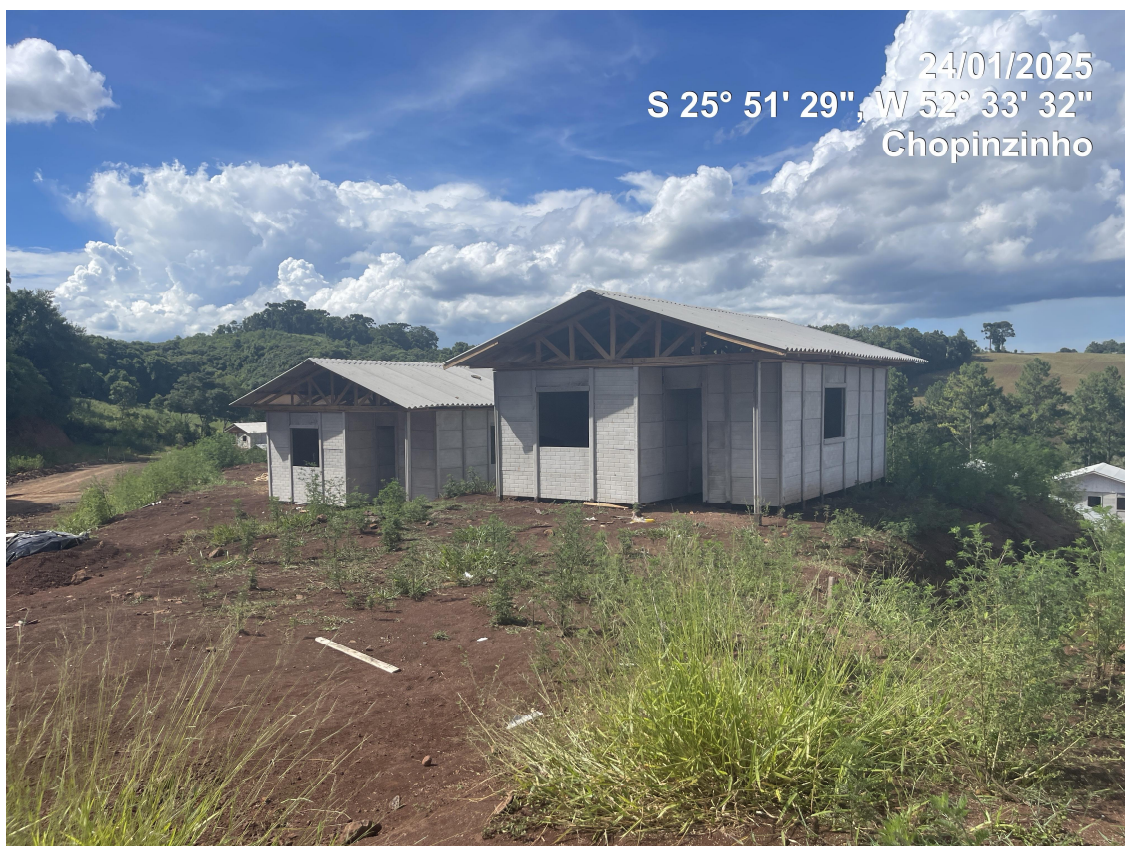
Foto 03 - Casas tipo Padrão de frente para Rua Joaquim Fávero (Local 06)