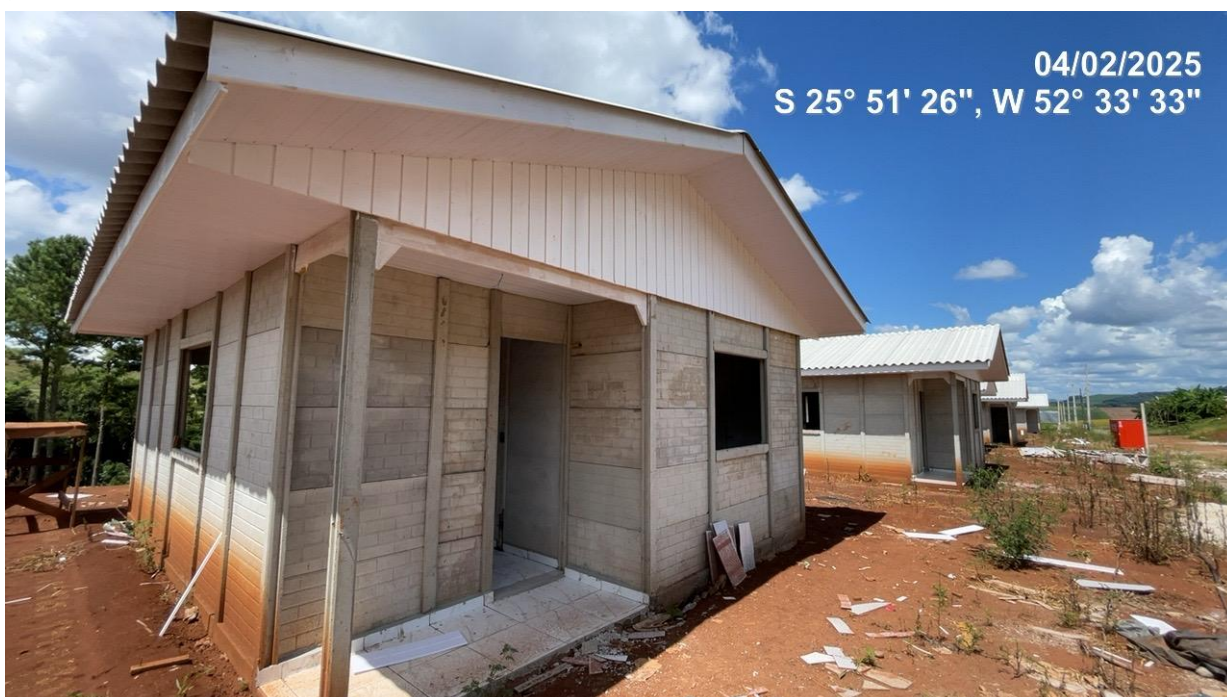
Foto 08 – Habitações tipo Padrão de frente para a R. Nébito Simões, com beiral, espelho e oitão finalizado – Local 02.