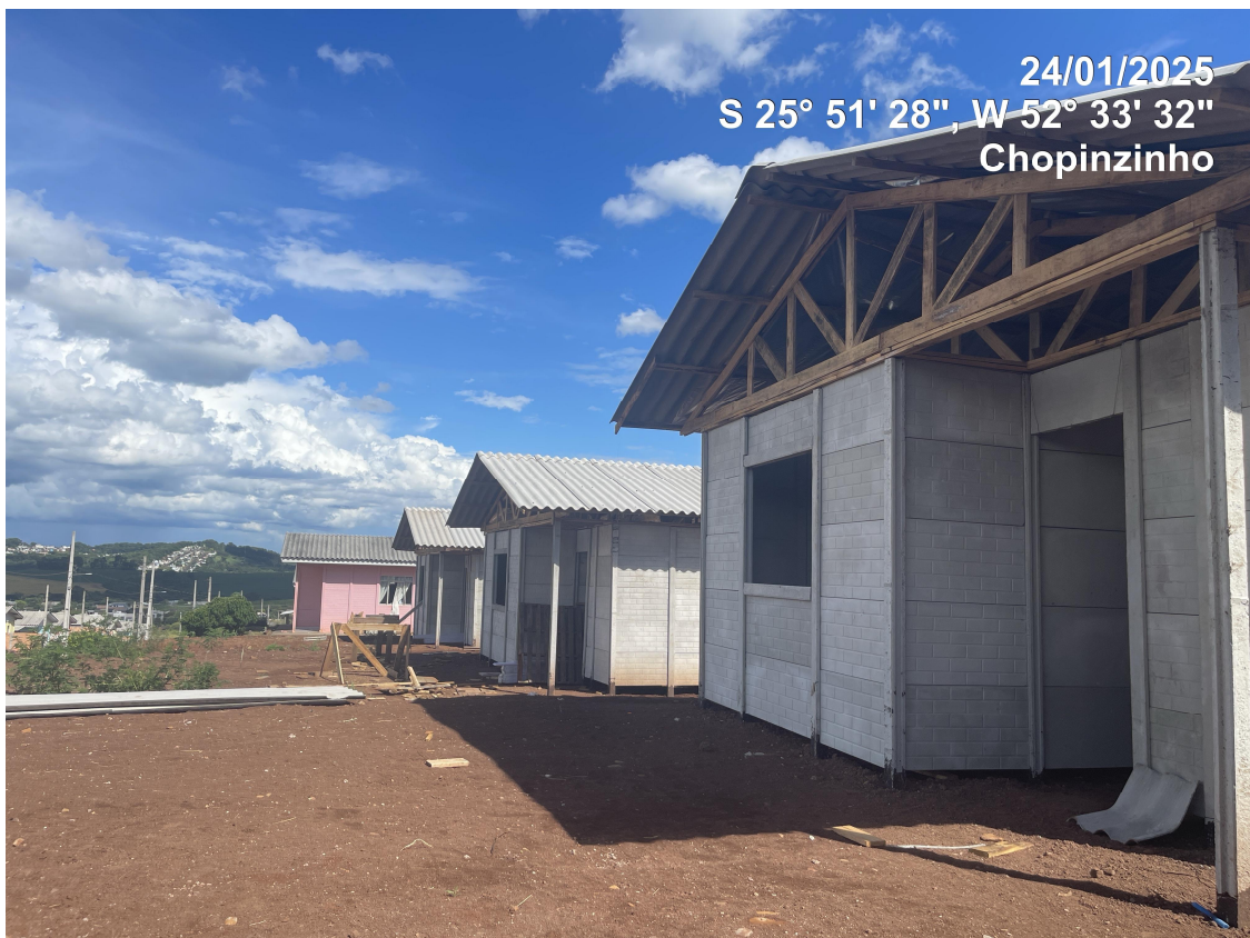
Foto 04 - Casas tipo Padrão de frente para Rua Nébito Simões de Oliveira (Local 05)