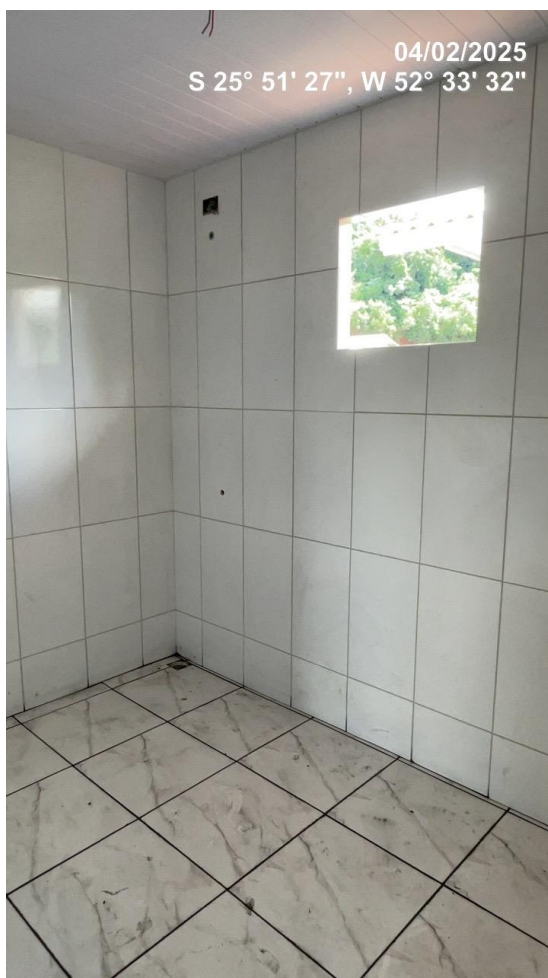
Foto 06 – Habitação Acessível com serviço de revestimento cerâmico, azulejos, elétrica e forro concluídos (Local 07)

04/02/2025 S 25° 51' 27", W 52° 33' 31" Chopinzinho