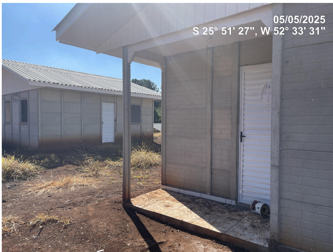
Foto 08 – Portas externas em alumínio instaladas (Local 01 e 02-07)