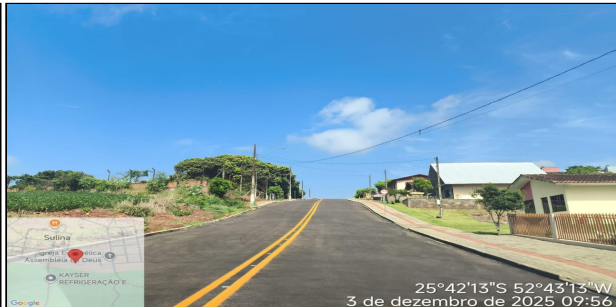
13 | RUA COMENDADOR ARAUJO - FIM - RUA COMENDADOR ARAÚJO SERVIÇO EXECUTADO DE TERRAPLENAGEM, BASE / SUB-BASE, REVESTIMENTO, SINALIZAÇÃO DE TRÂNSITO E