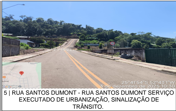
5 | RUA SANTOS DUMONT - RUA SANTOS DUMONT SERVIÇO EXECUTADO DE URBANIZAÇÃO, SINALIZAÇÃO DE TRÂNSITO.