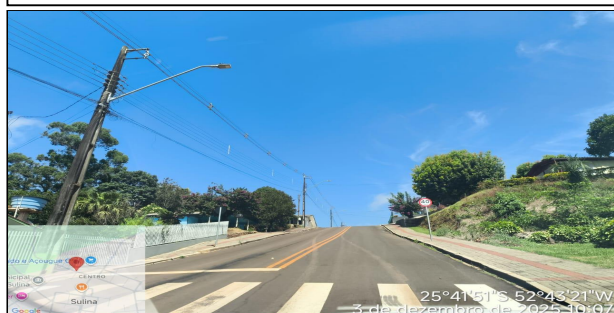
2 | AV IGUAÇU - INICIO AVENIDA IGUAÇU, SERVIÇO EXECUTADO DE SINALIZAÇÃO DE TRÂNSITO E DRENAGEM.