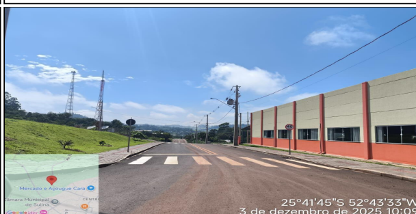
3 | AV IGUAÇU - FIM AVENIDA IGUAÇU, SERVIÇO EXECUTADO DE SINALIZAÇÃO DE TRÂNSITO E DRENAGEM.