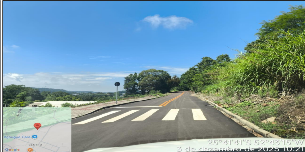
11 | RUA CASTELO BRANCO - INICIO - RUA CASTELO BRANCO, SERVIÇO EXECUTADO DE SINALIZAÇÃO DE TRÂNSITO.