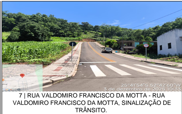
7 | RUA VALDOMIRO FRANCISCO DA MOTTA - RUA VALDOMIRO FRANCISCO DA MOTTA, SINALIZAÇÃO DE TRÂNSITO.