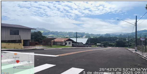
12 | RUA COMENDADOR ARAUJO - INICIO RUA COMENDADOR ARAÚJO SERVIÇO EXECUTADO DE TERRAPLENAGEM, BASE / SUB-BASE, REVESTIMENTO,