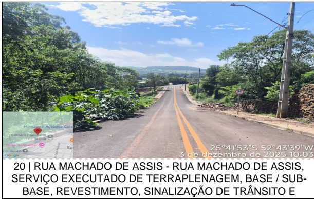
20 | RUA MACHADO DE ASSIS - RUA MACHADO DE ASSIS, SERVIÇO EXECUTADO DE TERRAPLENAGEM, BASE / SUB-BASE, REVESTIMENTO, SINALIZAÇÃO DE TRÂNSITO E