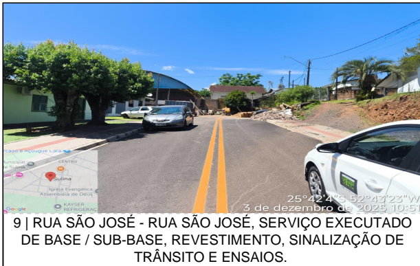
9 | RUA SÃO JOSÉ - RUA SÃO JOSÉ, SERVIÇO EXECUTADO DE BASE / SUB-BASE, REVESTIMENTO, SINALIZAÇÃO DE TRÂNSITO E ENSAIOS.