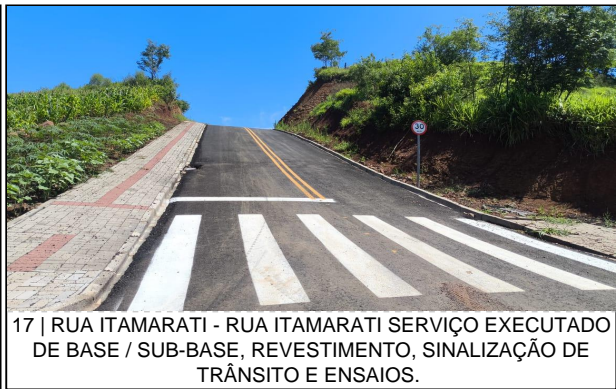
17 | RUA ITAMARATI - RUA ITAMARATI SERVIÇO EXECUTADO DE BASE / SUB-BASE, REVESTIMENTO, SINALIZAÇÃO DE TRÂNSITO E ENSAIOS.