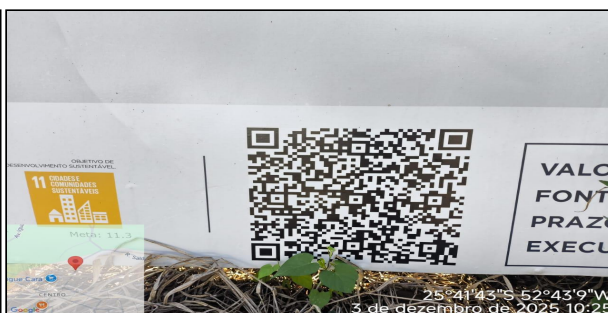
1 | QR CODE DA PLACA