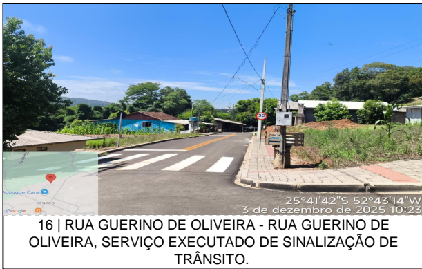
16 | RUA GUERINO DE OLIVEIRA - RUA GUERINO DE OLIVEIRA, SERVIÇO EXECUTADO DE SINALIZAÇÃO DE TRÂNSITO.