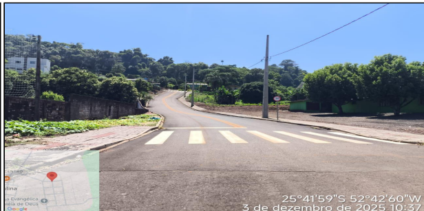
15 | RUA DOM PEDRO I - RUA DOM PEDRO I SERVIÇO EXECUTADO DE SINALIZAÇÃO DE TRÂNSITO.