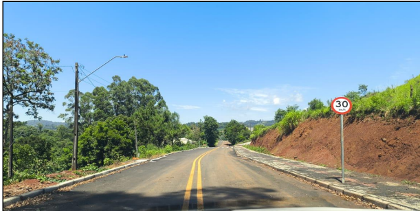
8 | RUA BARRÃO DO RIO BRANCO - RUA BARRÃO DO RIO BRANCO SERVIÇO EXECUTADO DE BASE / SUB-BASE, REVESTIMENTO, SINALIZAÇÃO DE TRÂNSITO E ENSAIOS.