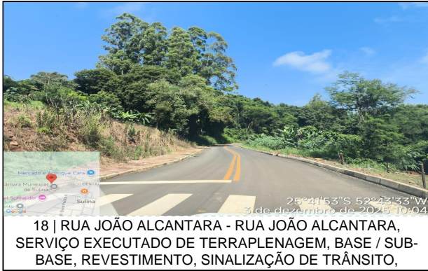
18 | RUA JOÃO ALCANTARA - RUA JOÃO ALCANTARA, SERVIÇO EXECUTADO DE TERRAPLENAGEM, BASE / SUB-BASE, REVESTIMENTO, SINALIZAÇÃO DE TRÂNSITO,