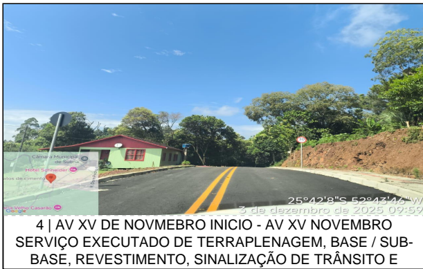
4 | AV XV DE NOVMEBRO INICIO - AV XV NOVEMBRO SERVIÇO EXECUTADO DE TERRAPLENAGEM, BASE / SUB-BASE, REVESTIMENTO, SINALIZAÇÃO DE TRÂNSITO E