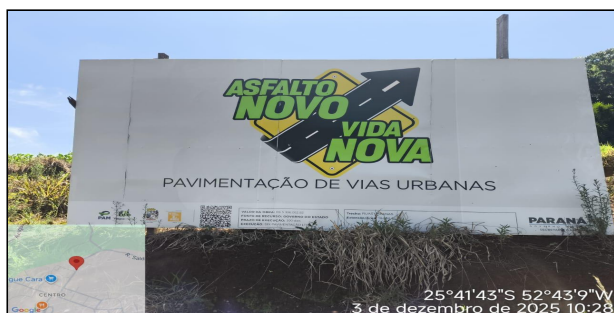
1 | PLACA DA OBRA