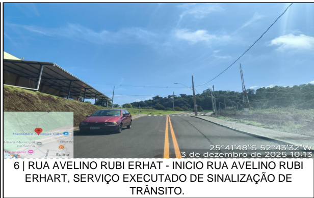
6 | RUA AVELINO RUBI ERHAT - INICIO RUA AVELINO RUBI ERHART, SERVIÇO EXECUTADO DE SINALIZAÇÃO DE TRÂNSITO.