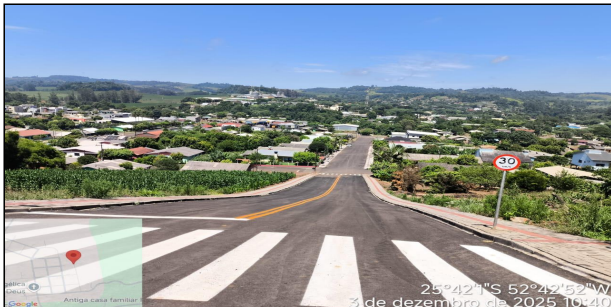
14 | RUA DAS AMERICAS - RUA DAS AMÉRICAS SERVIÇO EXECUTADO DE BASE / SUB-BASE, REVESTIMENTO, SINALIZAÇÃO DE TRÂNSITO E ENSAIOS.