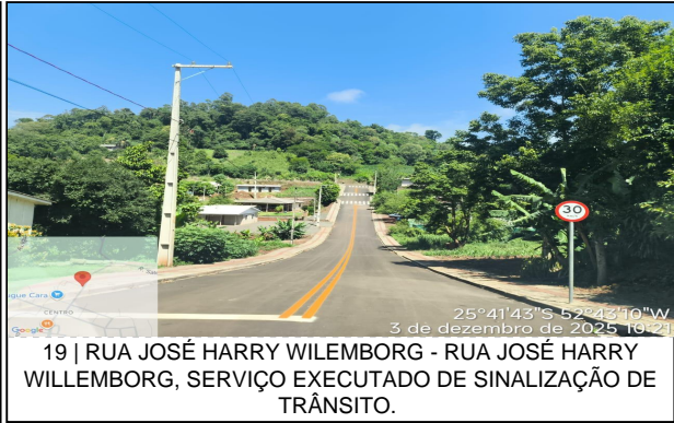
19 | RUA JOSÉ HARRY WILLEMBORG - RUA JOSÉ HARRY WILLEMBORG, SERVIÇO EXECUTADO DE SINALIZAÇÃO DE TRÂNSITO.