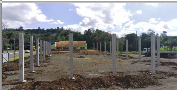
8 | SERVIÇO EXECUTADO PILAR PRÉ-FABRICADO EM CONCRETO ARMADO DE SEÇÃO 0.35X0.35X6,50MT, FORNECIMENTO E INSTALAÇÃO