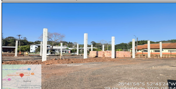
9 | SERVIÇO EXECUTADO PILAR PRÉ-FABRICADO EM CONCRETO ARMADO DE SEÇÃO 0.35X0.35X6,50MT, FORNECIMENTO E INSTALAÇÃO