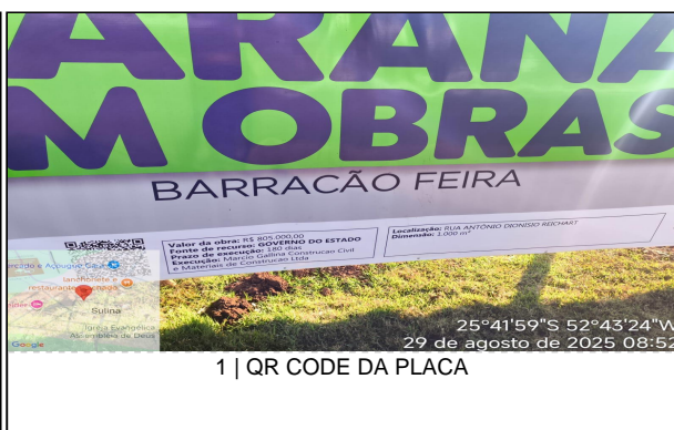
1 | QR CODE DA PLACA