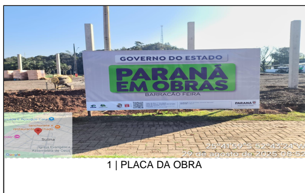
1 | PLACA DA OBRA