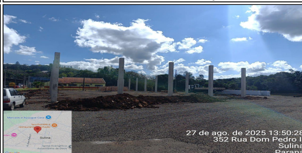
10 | SERVIÇO EXECUTADO PILAR PRÉ-FABRICADO EM CONCRETO ARMADO DE SEÇÃO 0.35X0.35X6,50MT, FORNECIMENTO E INSTALAÇÃO