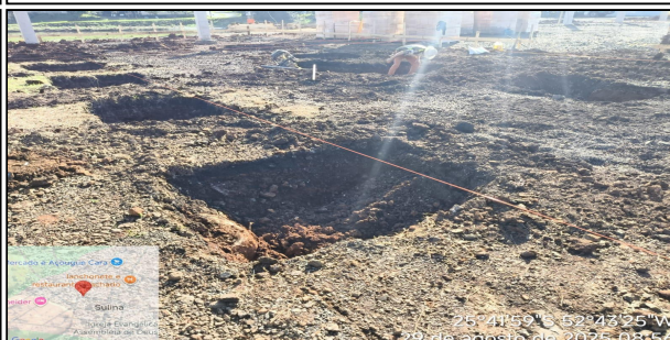
6 | SERVIÇO EXECUTADO ESCAVAÇÃO MANUAL DE VALA COM PROFUNDIDADE MENOR OU IGUAL A 1,30 M. AF_09/2024