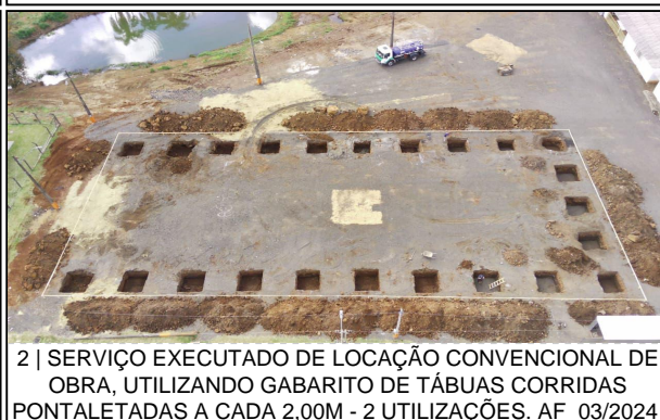
2 | SERVIÇO EXECUTADO DE LOCAÇÃO CONVENCIONAL DE OBRA, UTILIZANDO GABARITO DE TÁBUAS CORRIDAS PONTALETADAS A CADA 2,00M - 2 UTILIZAÇÕES. AF_03/2024