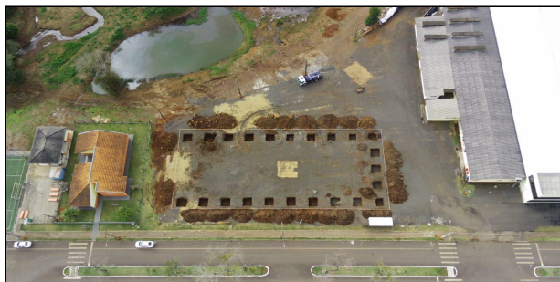
3 | SERVIÇO EXECUTADO DE LOCAÇÃO CONVENCIONAL DE OBRA, UTILIZANDO GABARITO DE TÁBUAS CORRIDAS PONTALETADAS A CADA 2,00M - 2 UTILIZAÇÕES. AF_03/2024