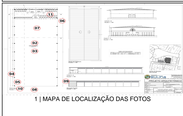
1 | MAPA DE LOCALIZAÇÃO DAS FOTOS