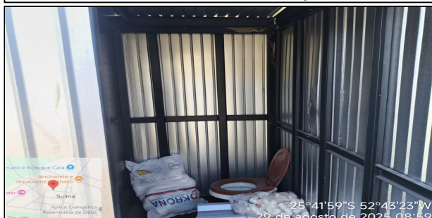
5 | SERVIÇO EXECUTADO EXECUÇÃO DE SANITÁRIO E VESTIÁRIO EM CANTEIRO DE OBRA EM CHAPA DE MADEIRA COMPENSADA, NÃO INCLUSO MOBILIÁRIO. AF_02/2016