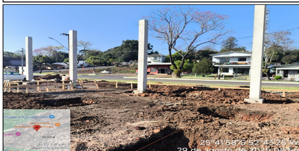
7 | SERVIÇO EXECUTADO ESCAVAÇÃO MECANIZADA DE VALA COM PROF. ATÉ 1,5 M (MÉDIA MONTANTE E JUSANTE/UMA COMPOSIÇÃO POR TRECHO), ESCAVADEIRA