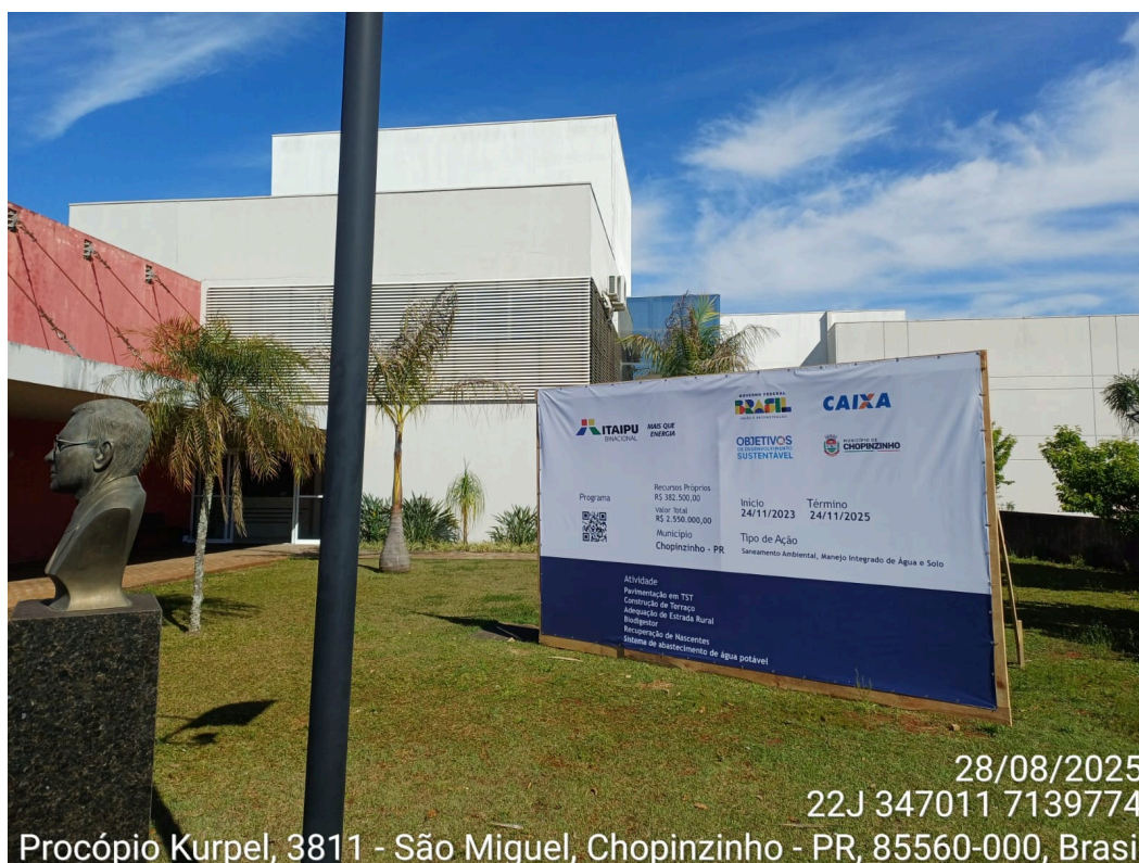
Procópio Kurpel, 3811 - São Miguel, Chopinzinho - PR, 85560-000, Brasil (Imagem da placa do convênio instalada no Paço Municipal)