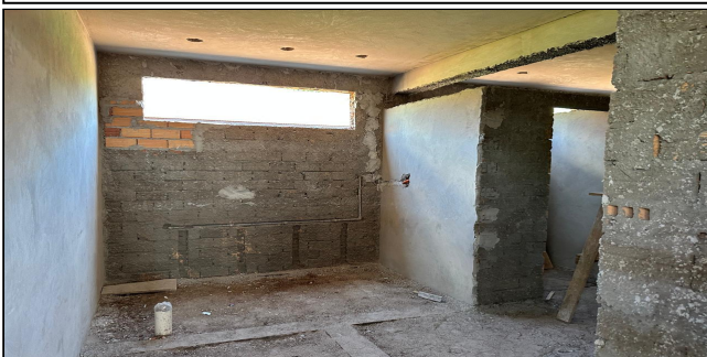
9 | SERVIÇO EXECUTADO