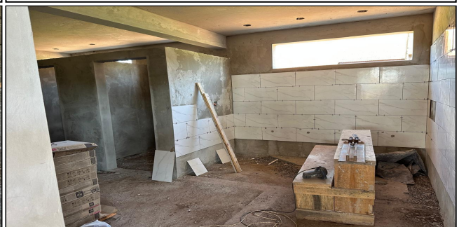
10 | SERVIÇO EXECUTADO