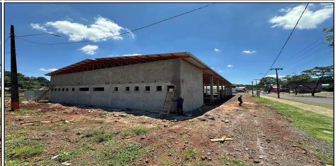
8 | SERVIÇO EXECUTADO