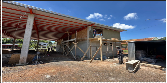
4 | SERVIÇO EXECUTADO