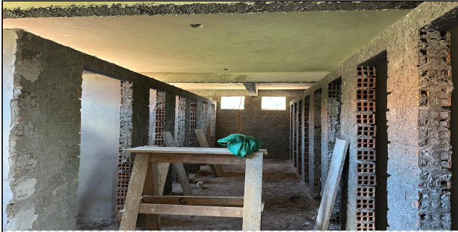
5 | SERVIÇO EXECUTADO