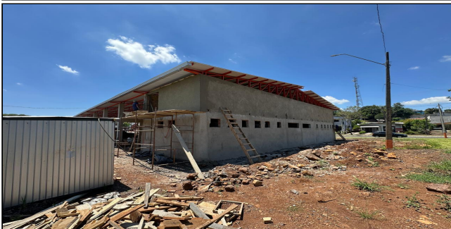
7 | SERVIÇO EXECUTADO