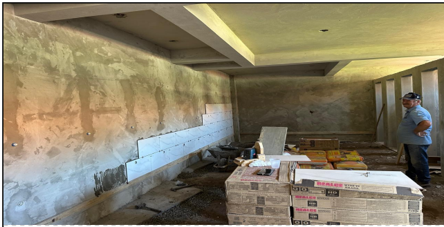
11 | SERVIÇO EXECUTADO

Versão digital: https://portaldosmunicipios.pr.gov.br/projeto-medicao/17035/lote/21415/medicao/17414/relatorio-fotografico/6870