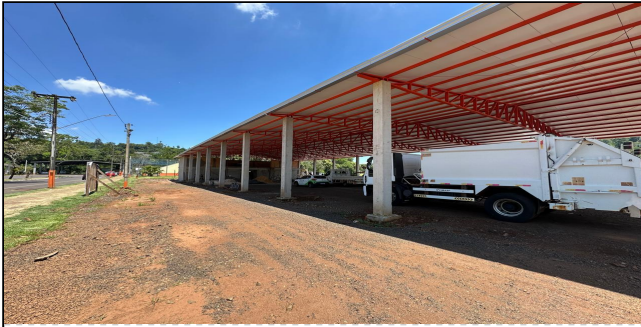
3 | SERVIÇO EXECUTADO