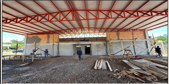
6 | SERVIÇO EXECUTADO