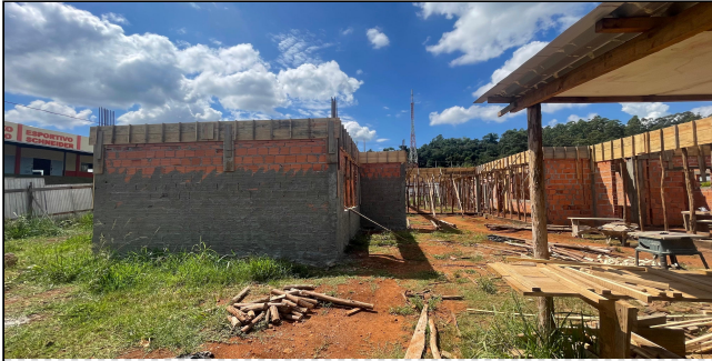
4 | FORMAS, ALVENARIA, CHAPISCO, VERGAS, CONTRA VERGAS