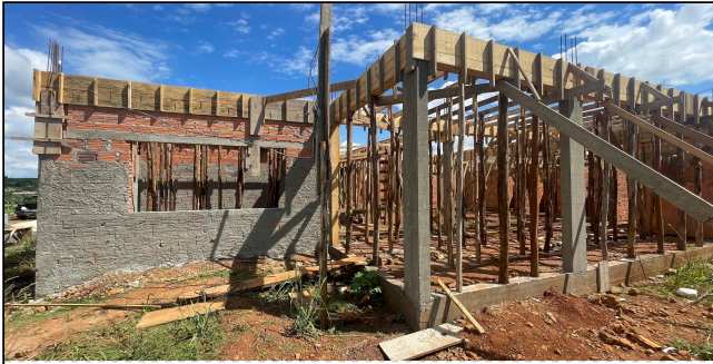
2 | FORMAS, ALVENARIA, CHAPISCO, VERGAS, CONTRA VERGAS