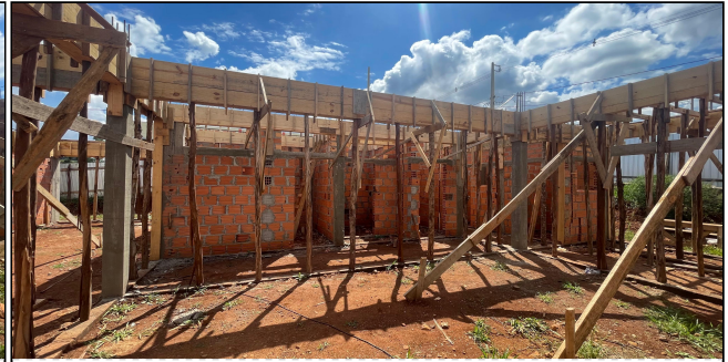
3 | FORMAS, ALVENARIA, CHAPISCO, VERGAS, CONTRA VERGAS