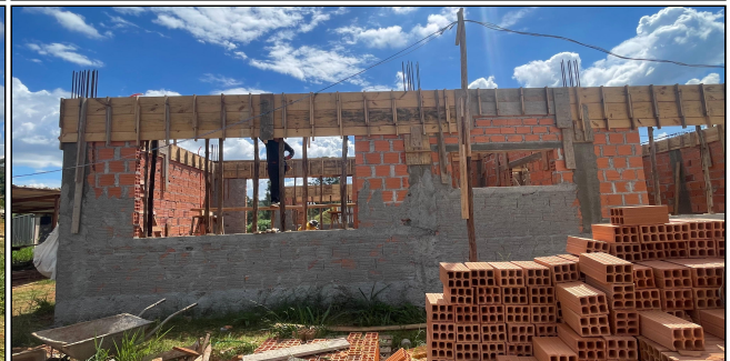
7 | FORMAS, ALVENARIA, CHAPISCO, VERGAS, CONTRA VERGAS