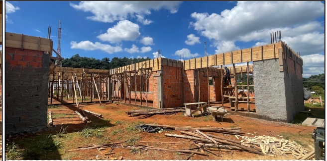
5 | FORMAS, ALVENARIA, CHAPISCO, VERGAS, CONTRA VERGAS