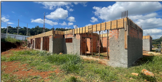
6 | FORMAS, ALVENARIA, CHAPISCO, VERGAS, CONTRA VERGAS