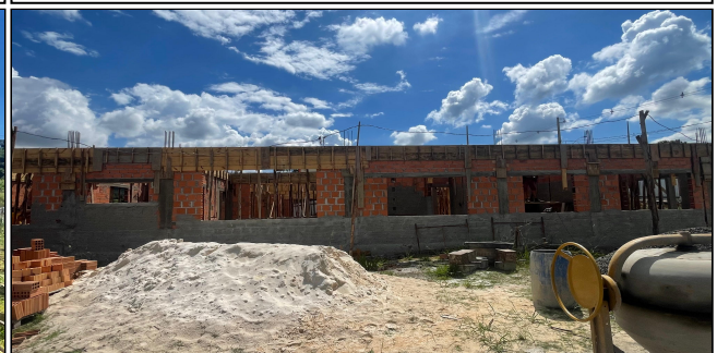
9 | FORMAS, ALVENARIA, CHAPISCO, VERGAS, CONTRA VERGAS