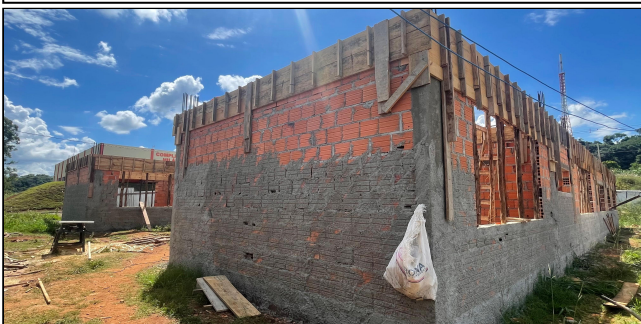
8 | FORMAS, ALVENARIA, CHAPISCO, VERGAS, CONTRA VERGAS