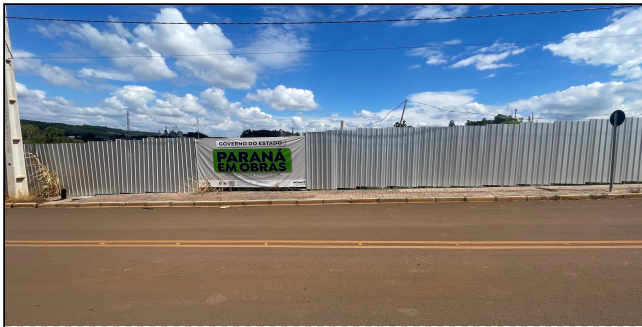
12 | FACHADA FRONTAL

Versão digital: https://portaldosmunicipios.pr.gov.br/projeto-medicao/17954/lote/22180/medicao/19359/relatorio-fotografico/8024