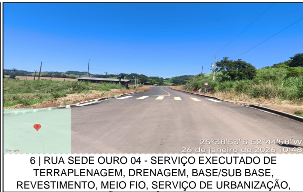
6 | RUA SEDE OURO 04 - SERVIÇO EXECUTADO DE TERRAPLENAGEM, DRENAGEM, BASE/SUB BASE, REVESTIMENTO, MEIO FIO, SERVIÇO DE URBANIZAÇÃO,