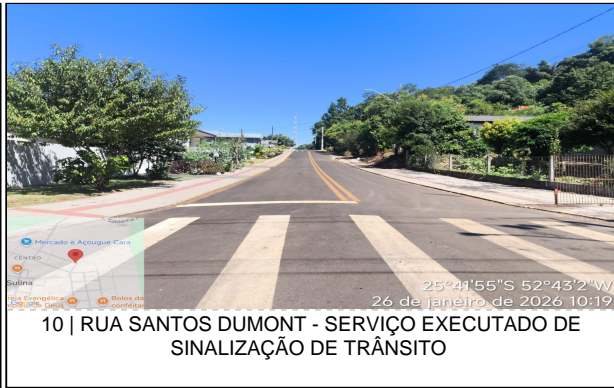
10 | RUA SANTOS DUMONT - SERVIÇO EXECUTADO DE SINALIZAÇÃO DE TRÂNSITO