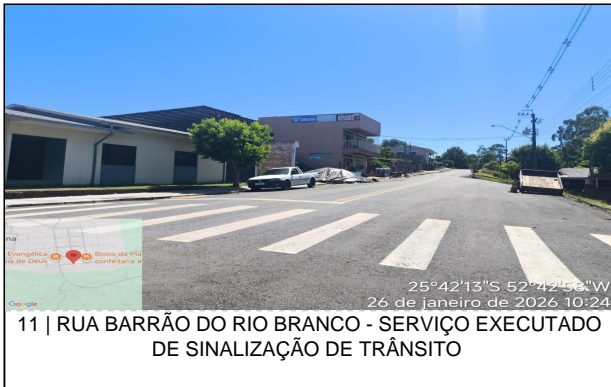
11 | RUA BARRÃO DO RIO BRANCO - SERVIÇO EXECUTADO DE SINALIZAÇÃO DE TRÂNSITO