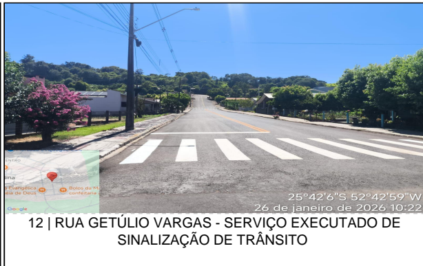
12 | RUA GETÚLIO VARGAS - SERVIÇO EXECUTADO DE SINALIZAÇÃO DE TRÂNSITO