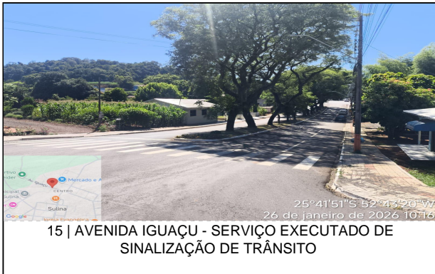
15 | AVENIDA IGUAÇU - SERVIÇO EXECUTADO DE SINALIZAÇÃO DE TRÂNSITO