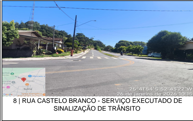
8 | RUA CASTELO BRANCO - SERVIÇO EXECUTADO DE SINALIZAÇÃO DE TRÂNSITO