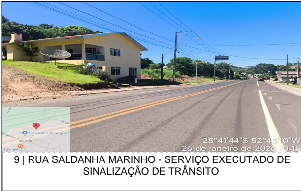
9 | RUA SALDANHA MARINHO - SERVIÇO EXECUTADO DE SINALIZAÇÃO DE TRÂNSITO