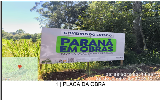
1 | PLACA DA OBRA