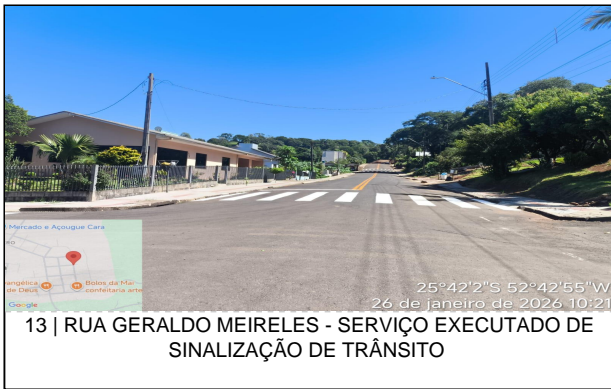
13 | RUA GERALDO MEIRELES - SERVIÇO EXECUTADO DE SINALIZAÇÃO DE TRÂNSITO