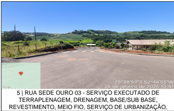
5 | RUA SEDE OURO 03 - SERVIÇO EXECUTADO DE TERRAPLENAGEM, DRENAGEM, BASE/SUB BASE, REVESTIMENTO, MEIO FIO, SERVIÇO DE URBANIZAÇÃO,