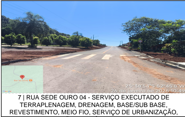
7 | RUA SEDE OURO 04 - SERVIÇO EXECUTADO DE TERRAPLENAGEM, DRENAGEM, BASE/SUB BASE, REVESTIMENTO, MEIO FIO, SERVIÇO DE URBANIZAÇÃO,