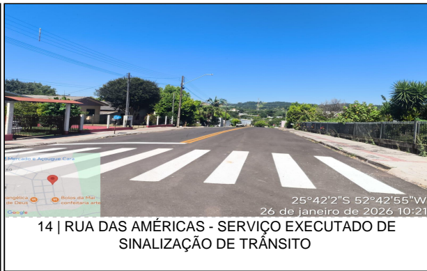
14 | RUA DAS AMÉRICAS - SERVIÇO EXECUTADO DE SINALIZAÇÃO DE TRÂNSITO