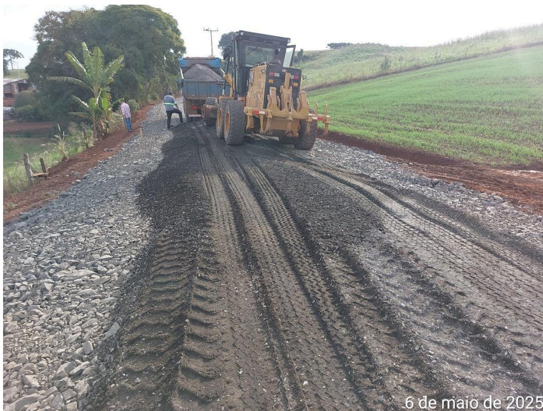
Foto 08. Execução da base em brita graduada.