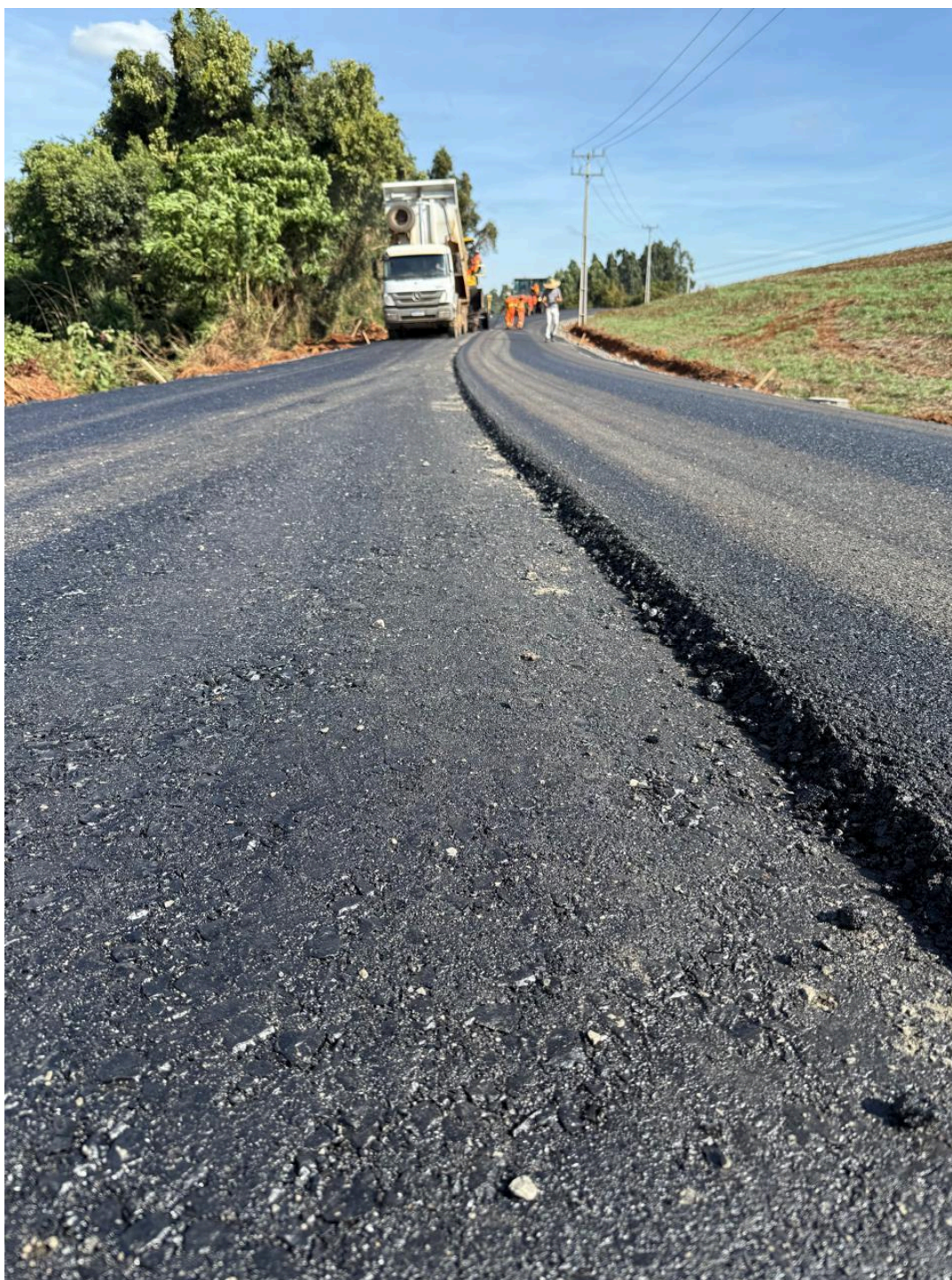
Foto 10. Execução da pavimentação asfáltica.