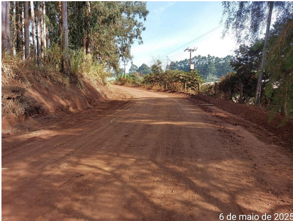
Foto 04. Execução da terraplanagem.