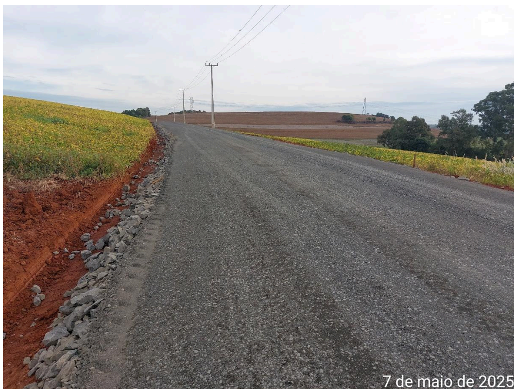
Foto 09. Execução da base em brita graduada.