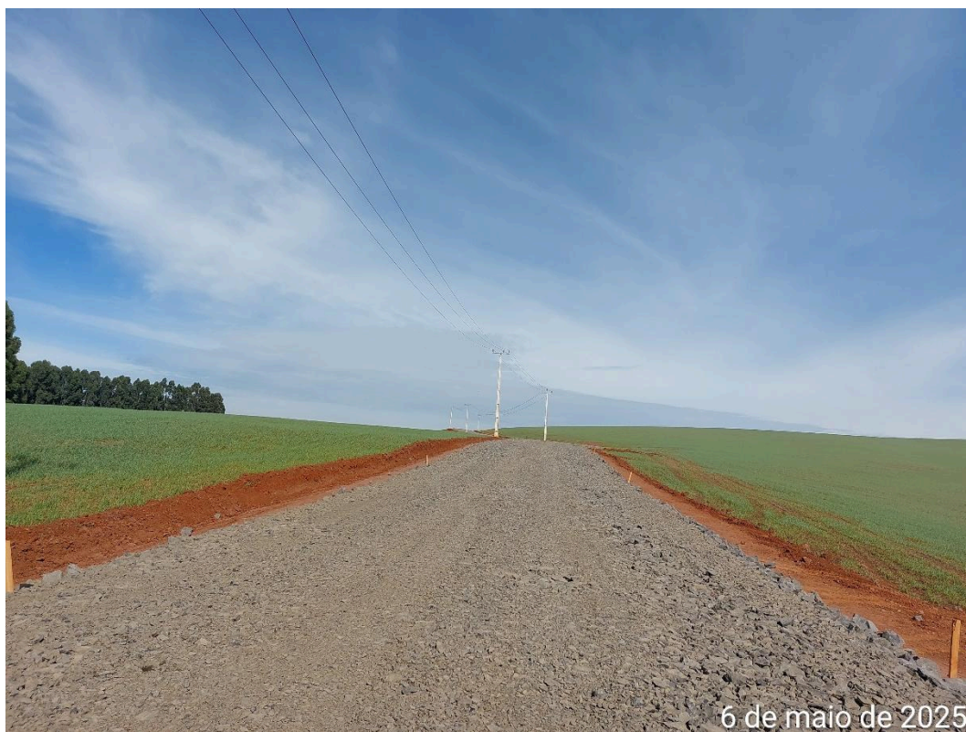
Foto 06. Execução da sub-base em macadame seco.