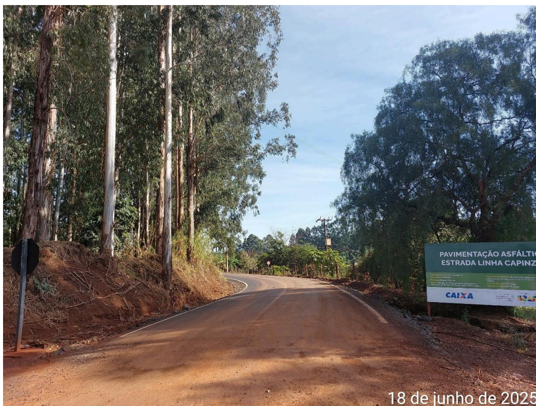
Foto 03. Placa da obra instalada próxima à estaca E1.