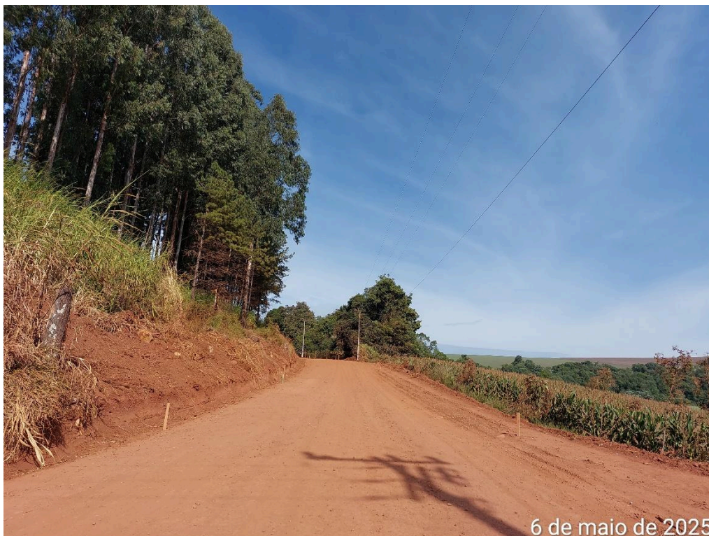
Foto 05. Execução da terraplanagem.