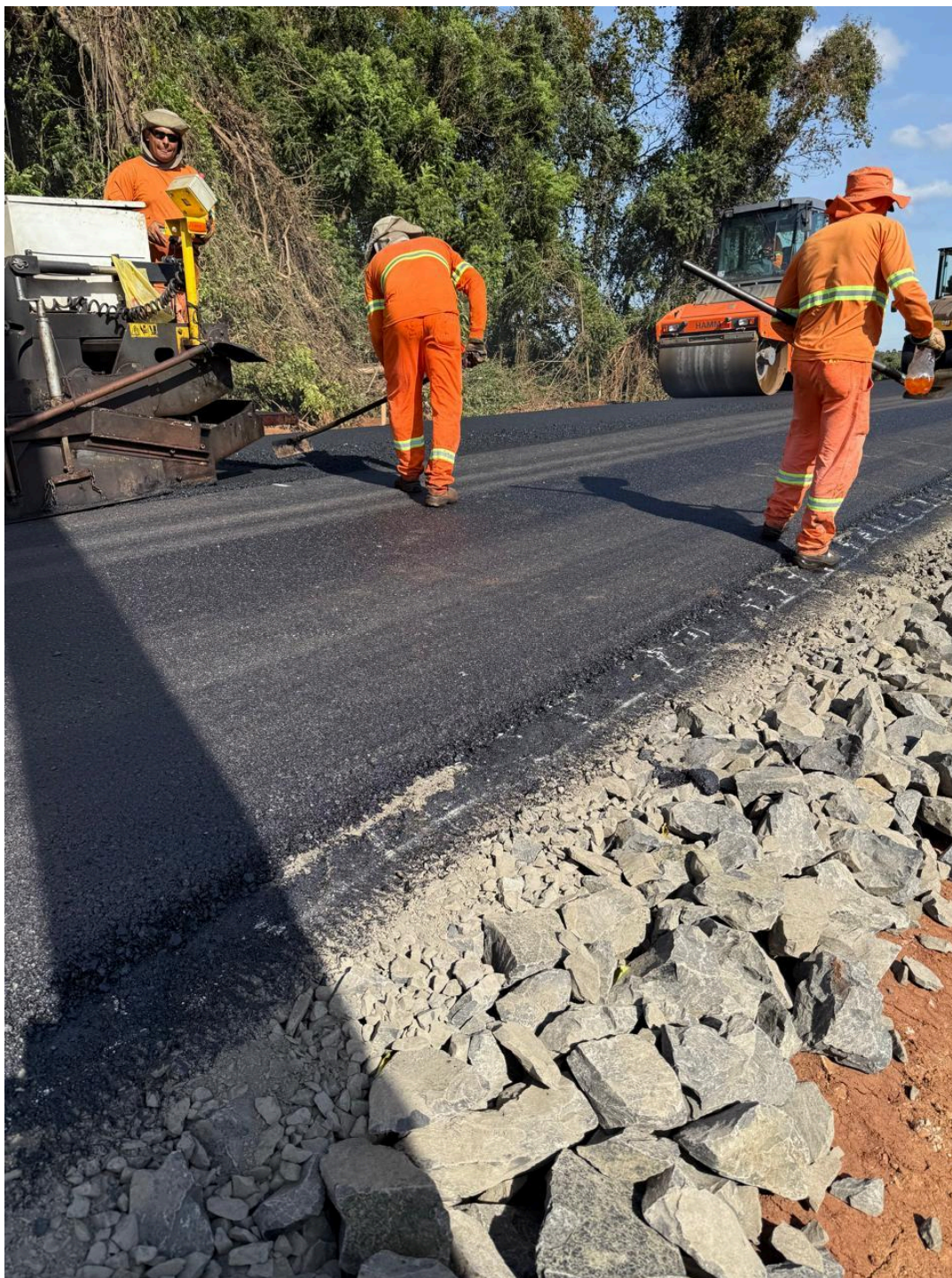
Foto 11. Execução da pavimentação asfáltica.