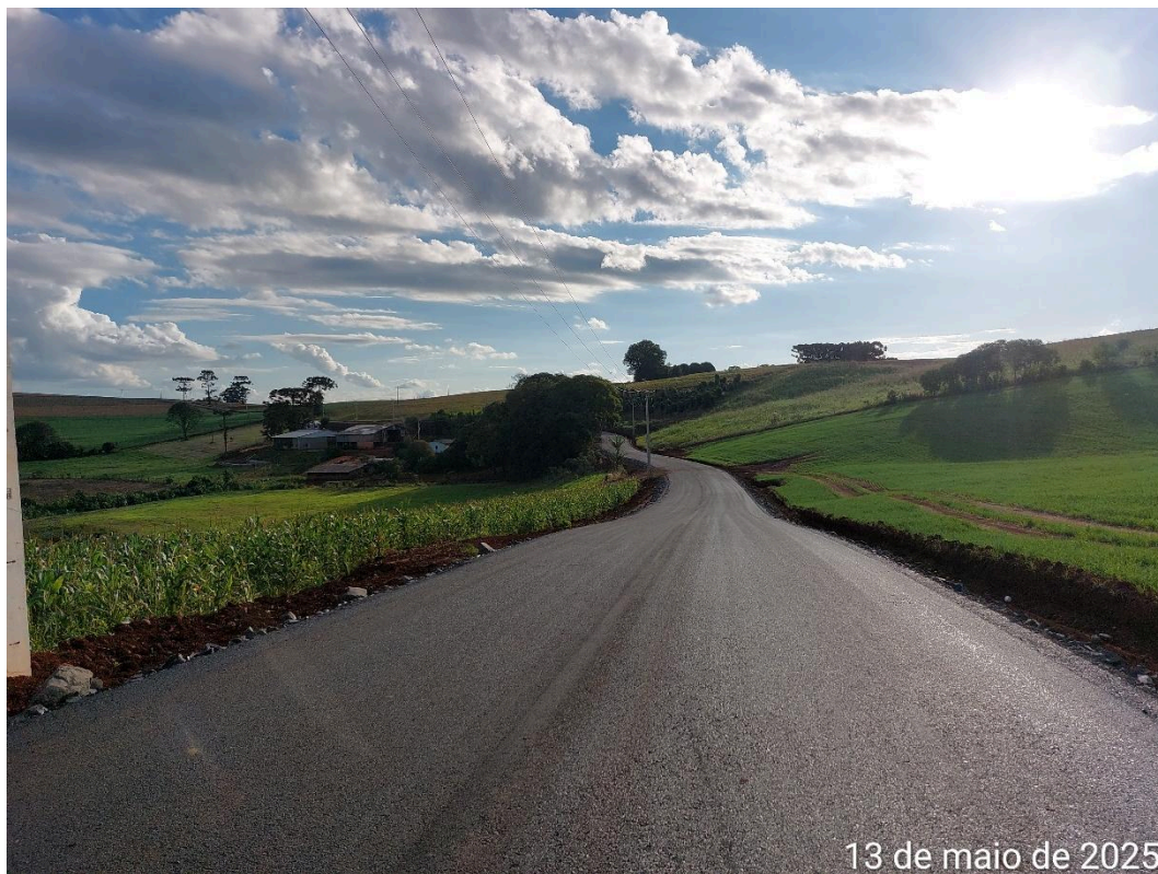
Foto 13. Execução da pavimentação asfáltica.