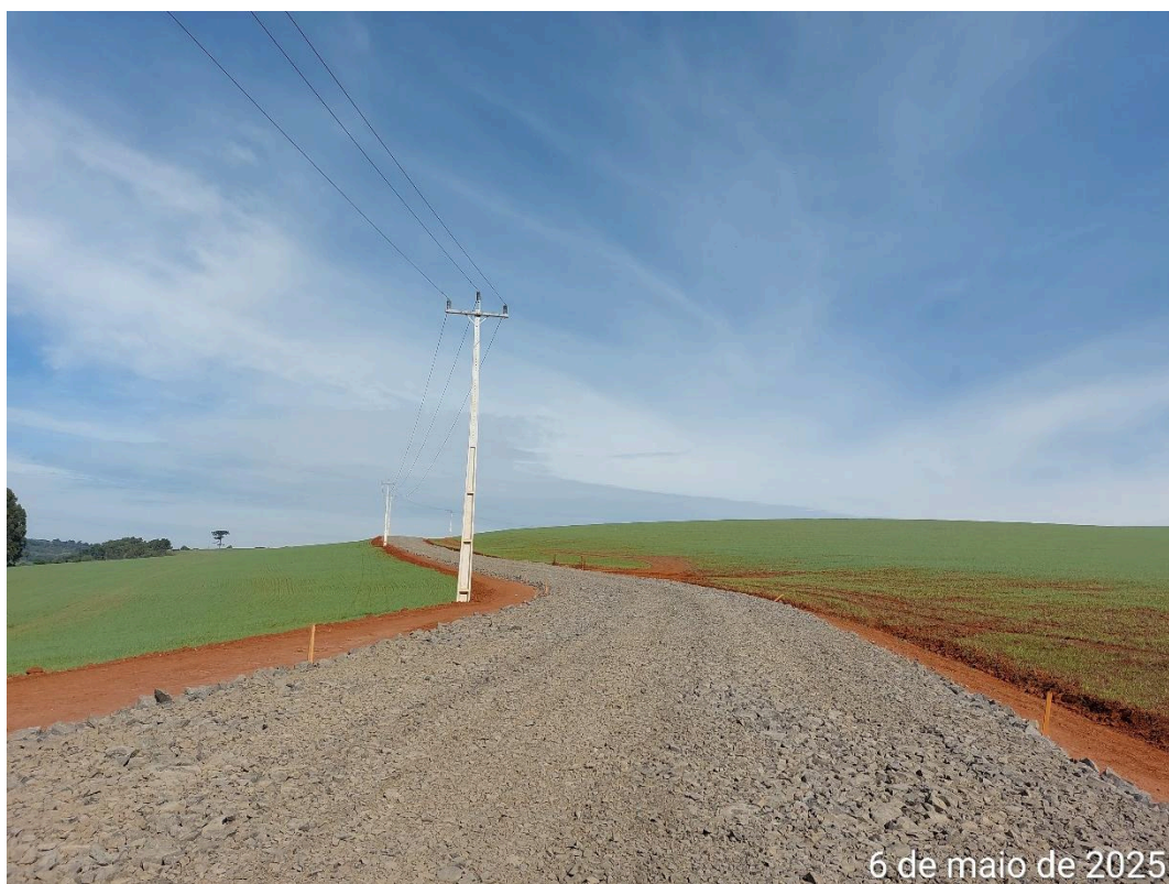
Foto 07. Execução da sub-base em macadame seco.