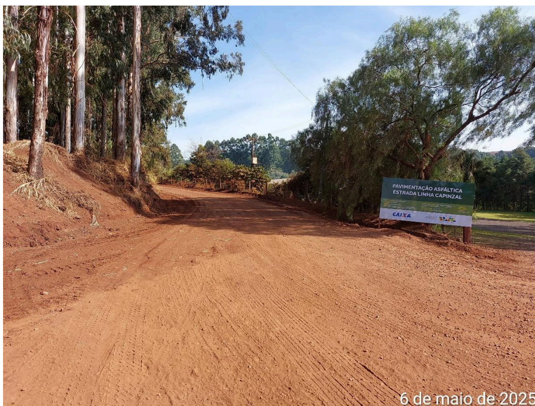
Foto 02. Placa da obra instalada próxima à estaca E1 no início da obra.