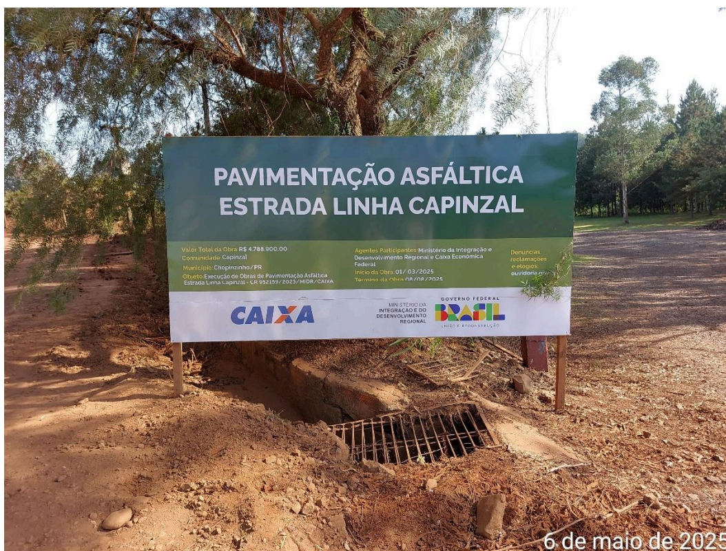
Foto 01. Placa da obra instalada próxima à estaca E1 no início da obra.